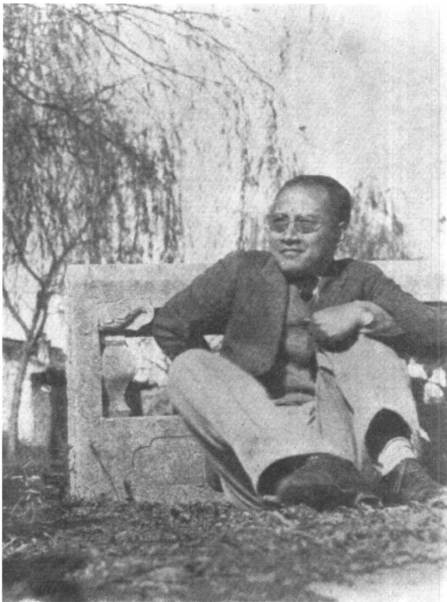
(一九三五年遊吳江時攝)