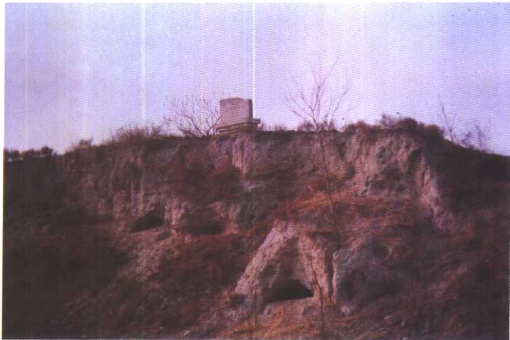
唐古寺——龙山文化遗址