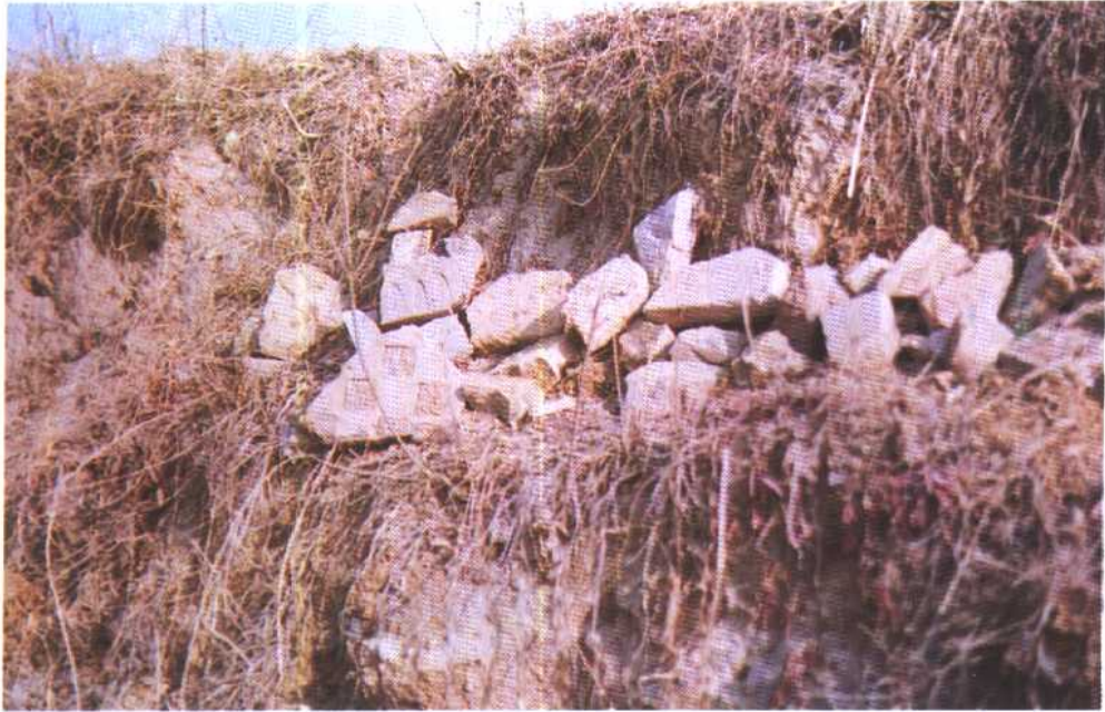
张家——仰韶文化遗址