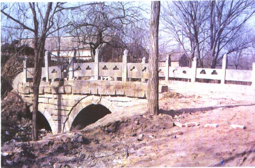
明代广济桥(曹村石桥)