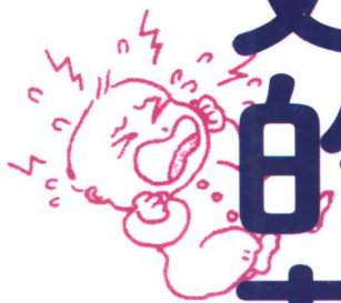
怎样认识孩子 “发脾气”