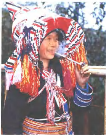
这也是塔型头饰，但“帽”的下部围住眼眉、双耳，红、金丝线特多，两肘几层衣袖各自镶边，线条分明。