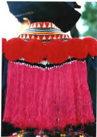
广西田林瑶族妇女背饰的局部。