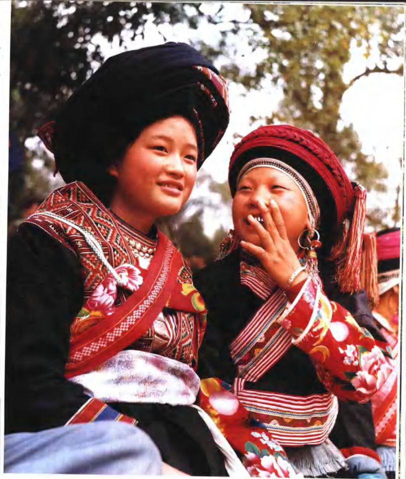
桂西地区的瑶族姑娘。