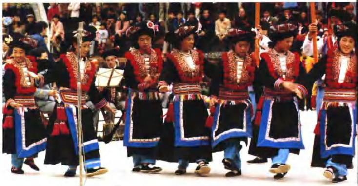
姑娘们穿着日常服饰，在欢庆盘王节的活动中间翩翩起舞。