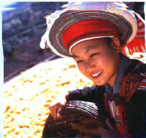
广西桂平瑶族服饰。

瑶族人民十分爱美。这种美，来自他们的劳动与生活，具有朴实、丰富而又千姿百态的自然美。披肩不仅起到保护肌肤的作用，还是一种精巧的装饰，其色彩的丰富和制作的精细，并不亚于其他服饰；头部装饰种类繁多，大都长条形带包头，层层叠叠地扎住头部，或扁或圆，或高或低，各自配上多色花巾、彩带或丝穗，风度翩翩。