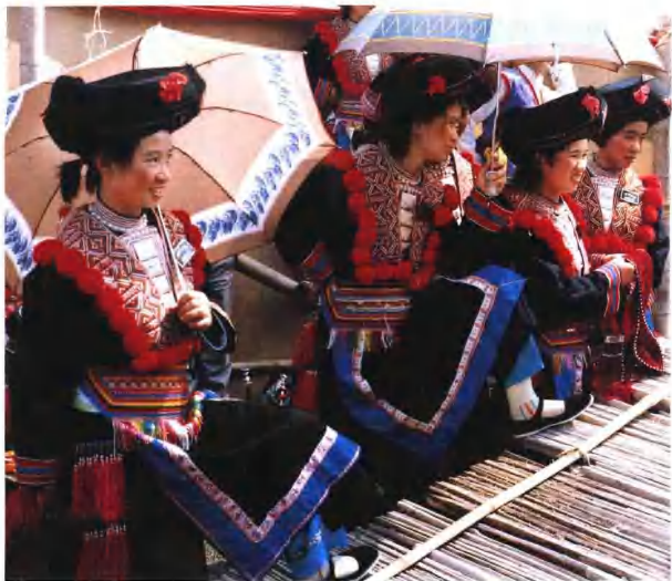
姑娘们在包头的花巾上插上一朵红花，使人自然感到一种纯朴的青春之美。