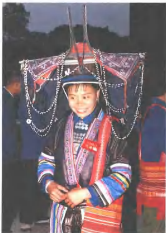
广西融水苗族自治县瑶族，头部戴上用铁条做成的架子，勾上瑶锦，并两边相对地吊着银色串珠，庄重、古朴。