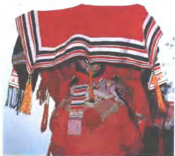
这是一种古老的瑶族婚礼盛装：头部戴着用彩布绣织成的布斗篷，黑底，前衣下摆红、绿、黄几种颜色相配。