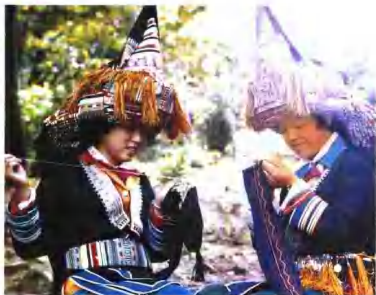
瑶族妇女十分勤劳，善于挑花刺绣。

广西贺县瑶族的服饰，除上下身与其他地区瑶族类似之外，尤其特色的是头部装饰：呈三角形的塔形帽子共十余层。瑶胞说：戴着这种帽，进密林，入草丛，就可“打草惊蛇”，保护自身安全。