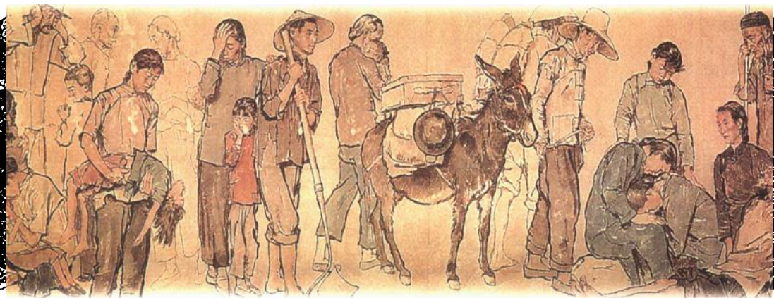
■生老病死四苦相（蔣兆和繪）

精魄辭生路，游魂入死關， 只聞千萬去，不見一人還。 寶馬空嘶立，庭花永絕攀， 早求無上道，應免四方山。