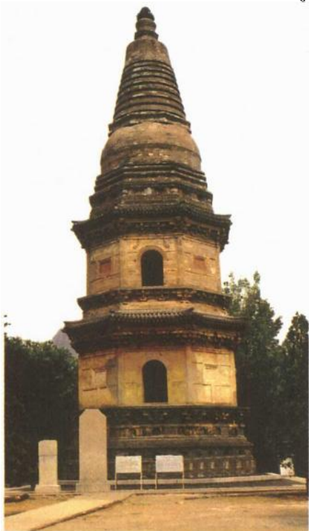
■房山雲居石經山藏經洞府（河北）