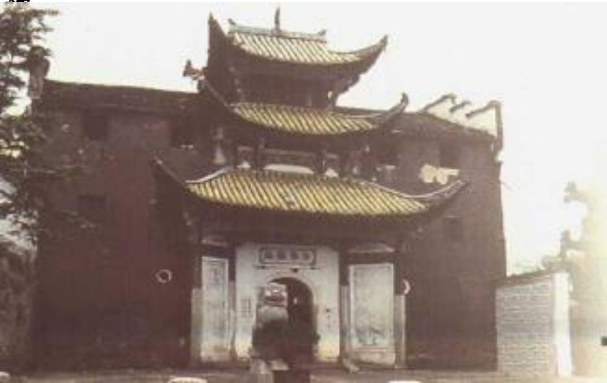
九華山祇園寺（安慶）

一如體玄，兀爾忘緣。萬法齊觀，歸復自然。泯其所以，不可方比。止動無動，動止無止。兩既不成，一何有爾？究竟窮極，不存軌則。啓心平等，所作俱息。狐疑盡淨，正信調直。一切不留，無可記憶。虛明自然，不勞心力。非思量處，識情難測。眞如法界，無他無自。要急相應，唯言不二。不二皆同，無不包容。十方智者，皆入此宗。宗非促延，一念萬年。無在不在，十方目前。極小同大，妄絕境界。極大同小，不見邊表。有即是無，無即是有。若不如是，必不須守。一即一切，一切即一。但能如是，何慮不畢？信心不二，不二信心。言語道斷，非去來今。