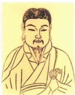
■ 傅大士 · 善慧