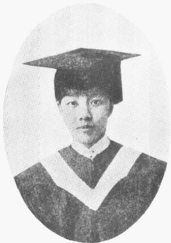
作者像（1923年毕业于燕京大学时摄）