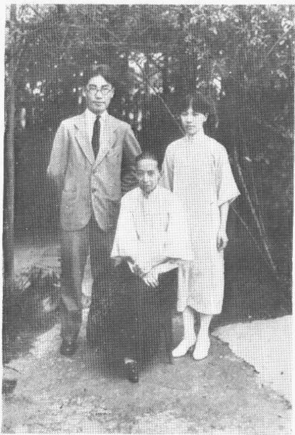
作者和她的母亲及吴文藻（1929年摄于上海）