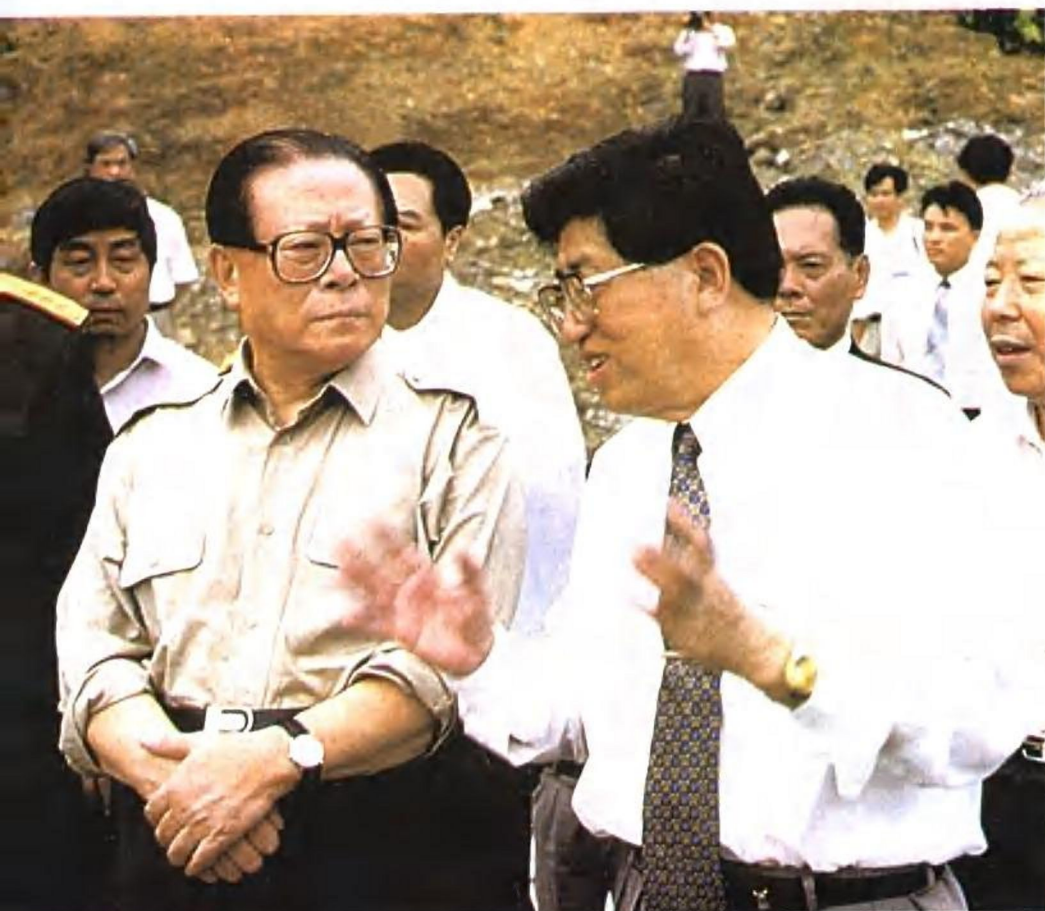
1996年10月31日江泽民总书记视察南昆铁路