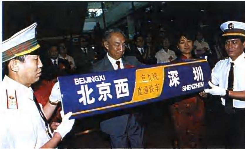
1996年9月1日邹家华副总理为京九铁路开通揭牌