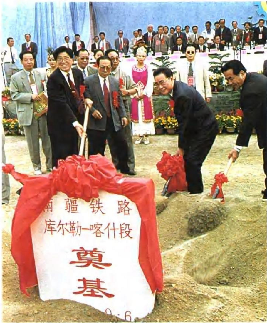
1996年9月6日李鹏总理为南疆铁路奠基