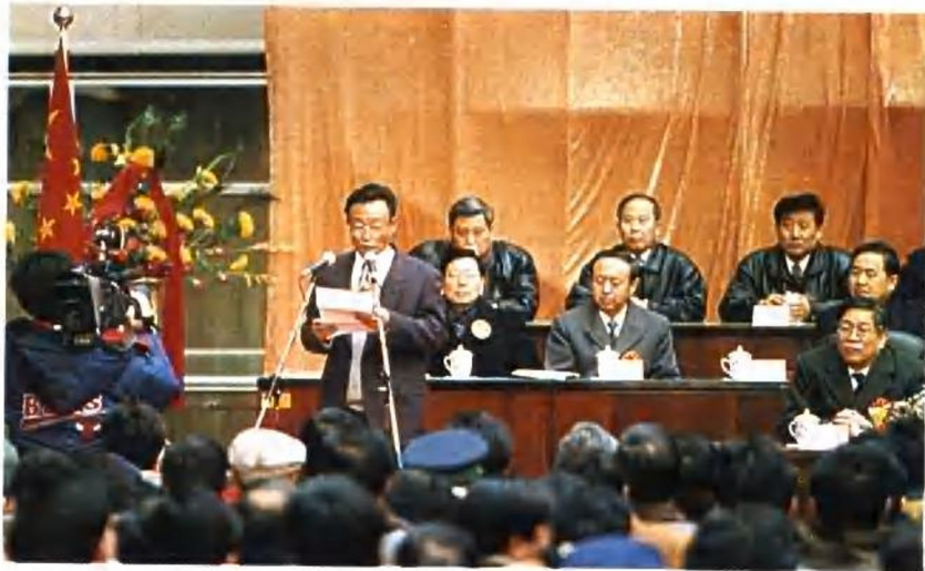
1996年1月21日吴邦国副总理在北京西站 开通运营庆典上讲话