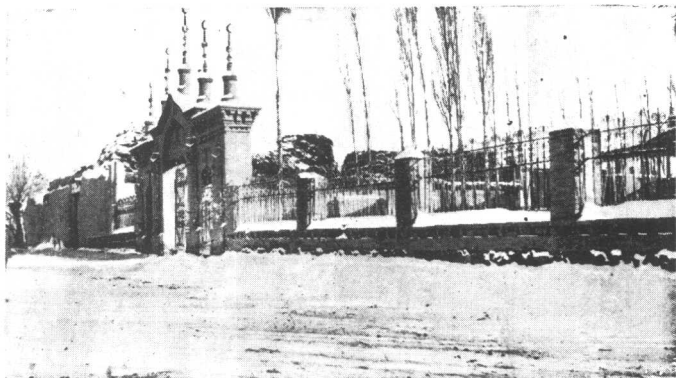
(二) 新疆塔城回教禮拜寺