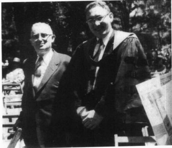
1954年基辛格在 哈佛大学获博士学位 后与父亲在一起