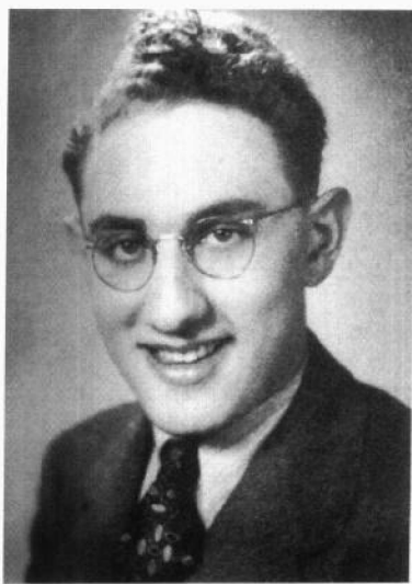
十六岁时的基辛格