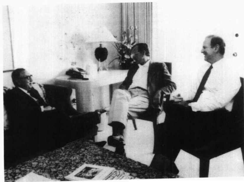
1990年与美国总统乔治·布什（中）和国务卿詹姆斯·贝克在一起