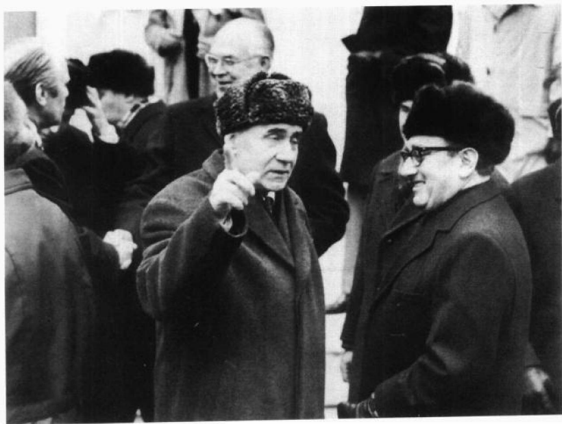
1974年11月与苏联外长葛罗米柯在一起