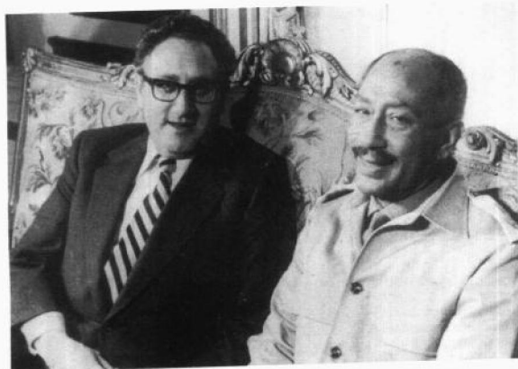
1973年与埃及总统 萨达特在一起