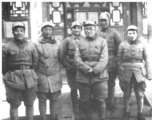
1940年4月，八路军129师师长刘伯承（右三）、政治委员邓小平（左三）、参谋长李达（左）、政治部主任蔡树藩（右）等在山西省辽县（今左权）与晋察冀军区司令员聂荣臻（左二）合影。