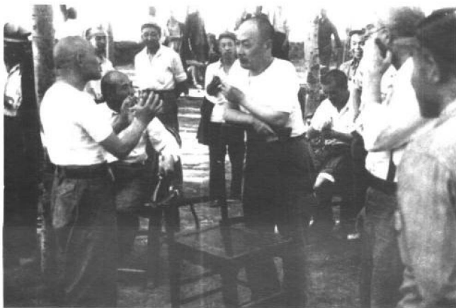
1948年，中原军区司令员刘伯承（右二）、政治委员邓小平（左）、副司令员陈毅（左三）、参谋长李达（左二，坐者），等在宝丰会议上。