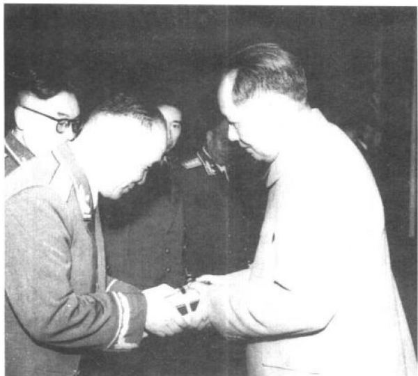
1955年，毛泽东主席为李达等将军授勋奖章。