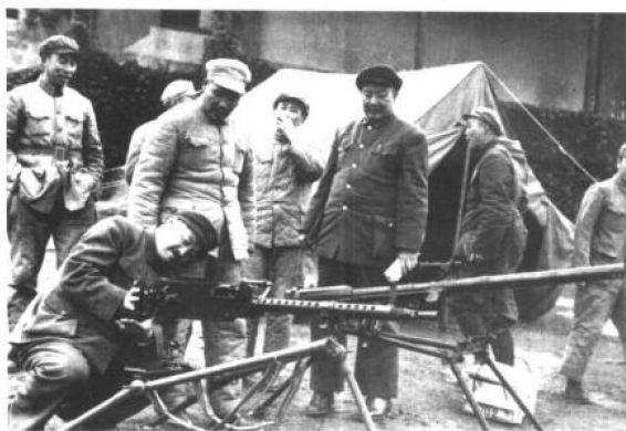
1950年，西南军区接受了进军西藏的任务。这是李达副司令员(中左一)陪同贺龙司令员(前)检查进藏部队的武器。