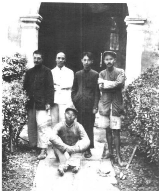
1935年8月，长征途中，李达（左二）与贺龙（左一）、关向应（右二）、任弼时（右一）王震（前坐者）在湖南澧县。