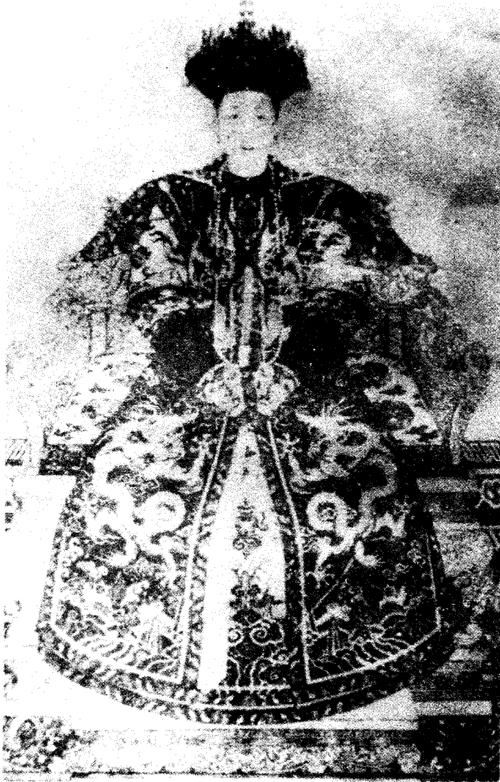
清圣祖后孝恭仁皇后（雍正生母）