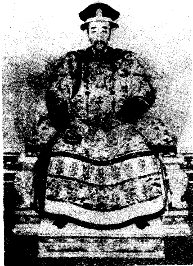
清圣祖康熙（雍正之父）