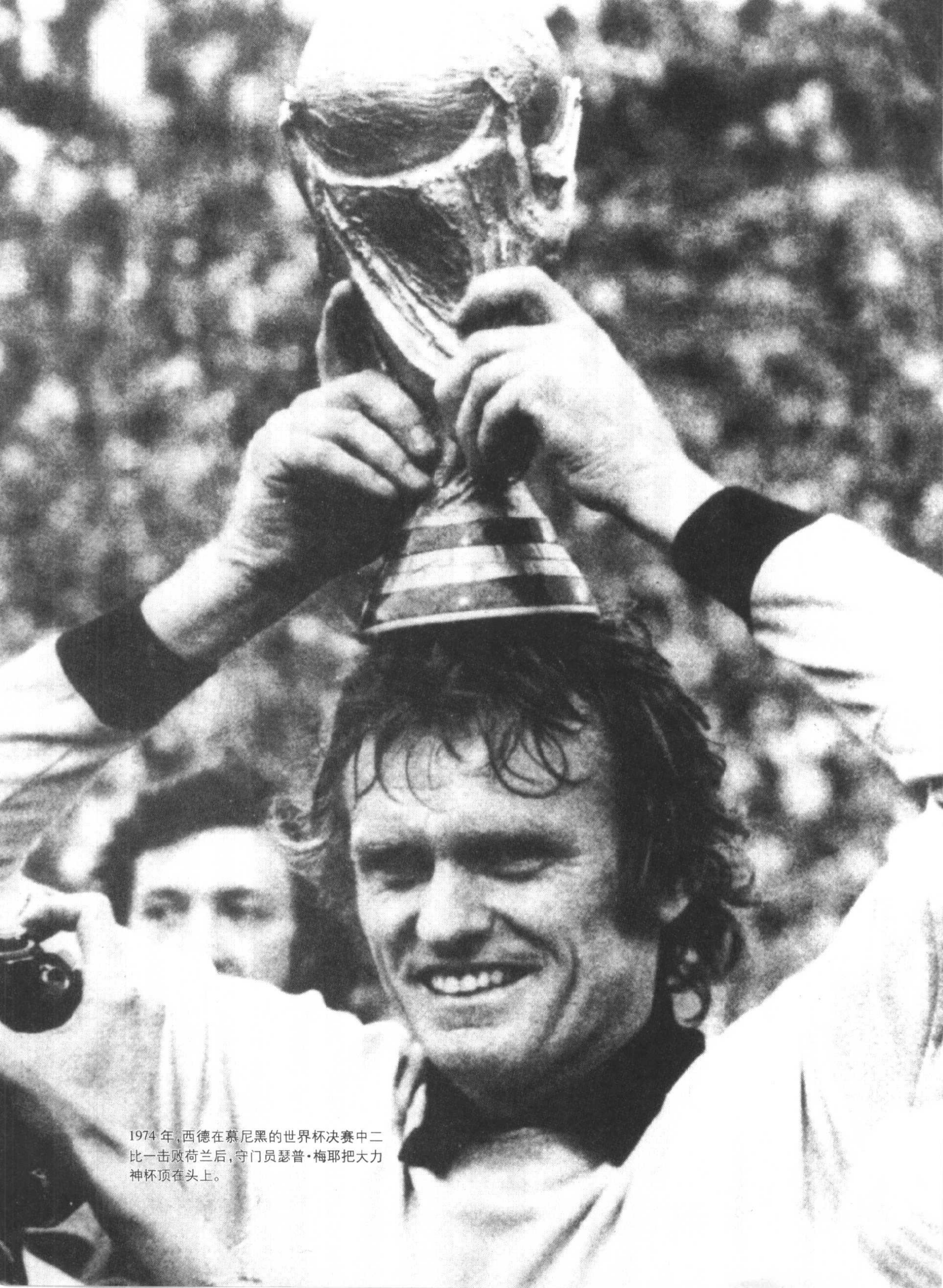
1974年，西德在慕尼黑的世界杯决赛中二比一击败荷兰后，守门员瑟普·梅耶把大力神杯顶在头上。