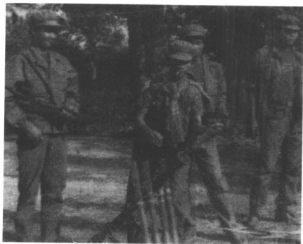
丛林里的红色高棉战士。