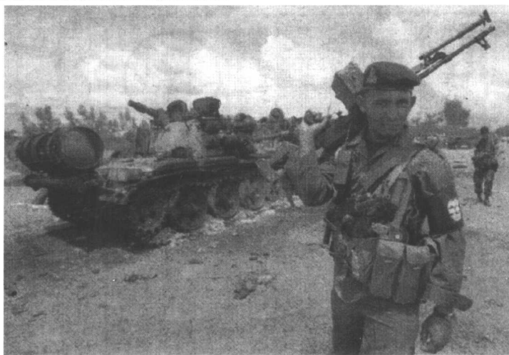
一名柬埔寨人民党 指挥官在金边站在一辆 烧毁的坦克前。