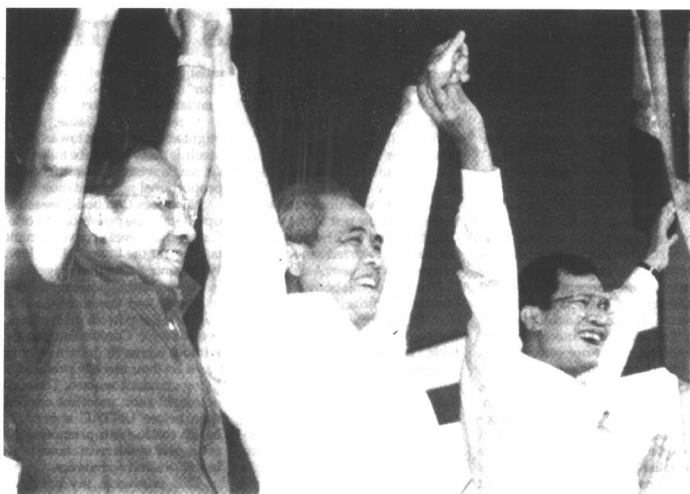
柬人民党的三位领导人：韩桑林（左），谢辛（中），洪森（右）。