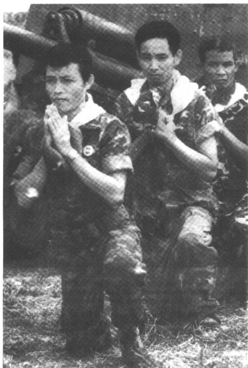
在向红色高棉发起进攻 前政府军士兵做祈祷仪式。