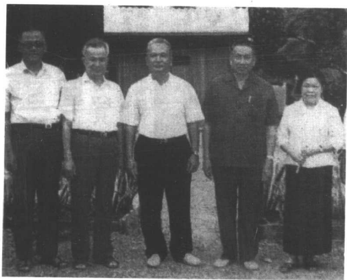
这是波尔布特（右二）与红色高棉其他领导人乔森潘（左二）、宋成（左一，已被杀）、农谢（前副书记）及宋成之妻摄于1986年的照片。