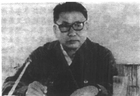
波尔布特1979年在美国中央情报局的档案照片。