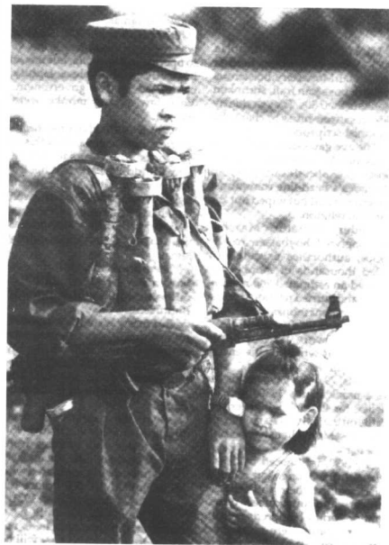
忠于波尔布特的年轻红色高棉战士。