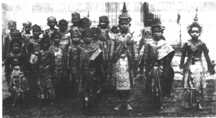
早年的王宫舞蹈团。当年波尔布特的表姐也是其中一员。