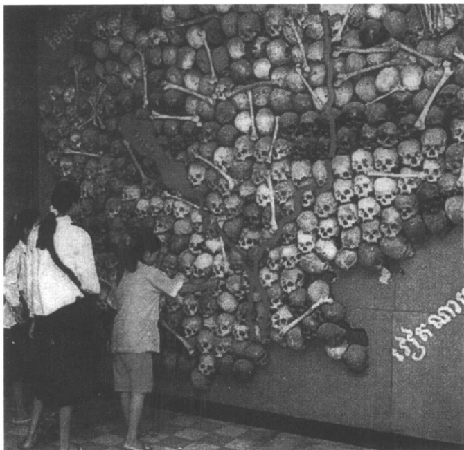
红色高棉执政时期的监狱现被列为“种族屠杀”纪念馆，此为馆内用人头骨拼成的柬埔寨地图。据说这些人都死于红色高棉执政时期。