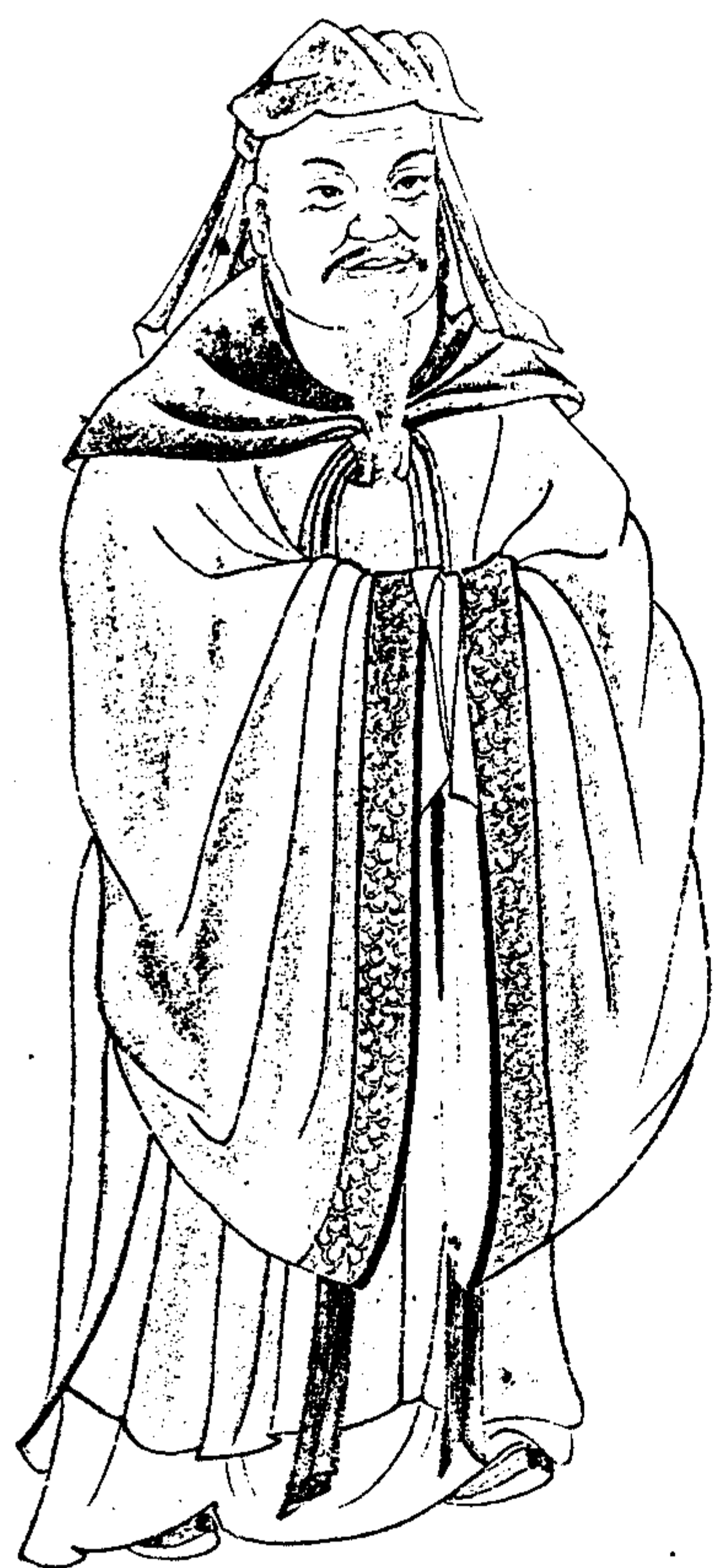
东汉太尉杨震公像