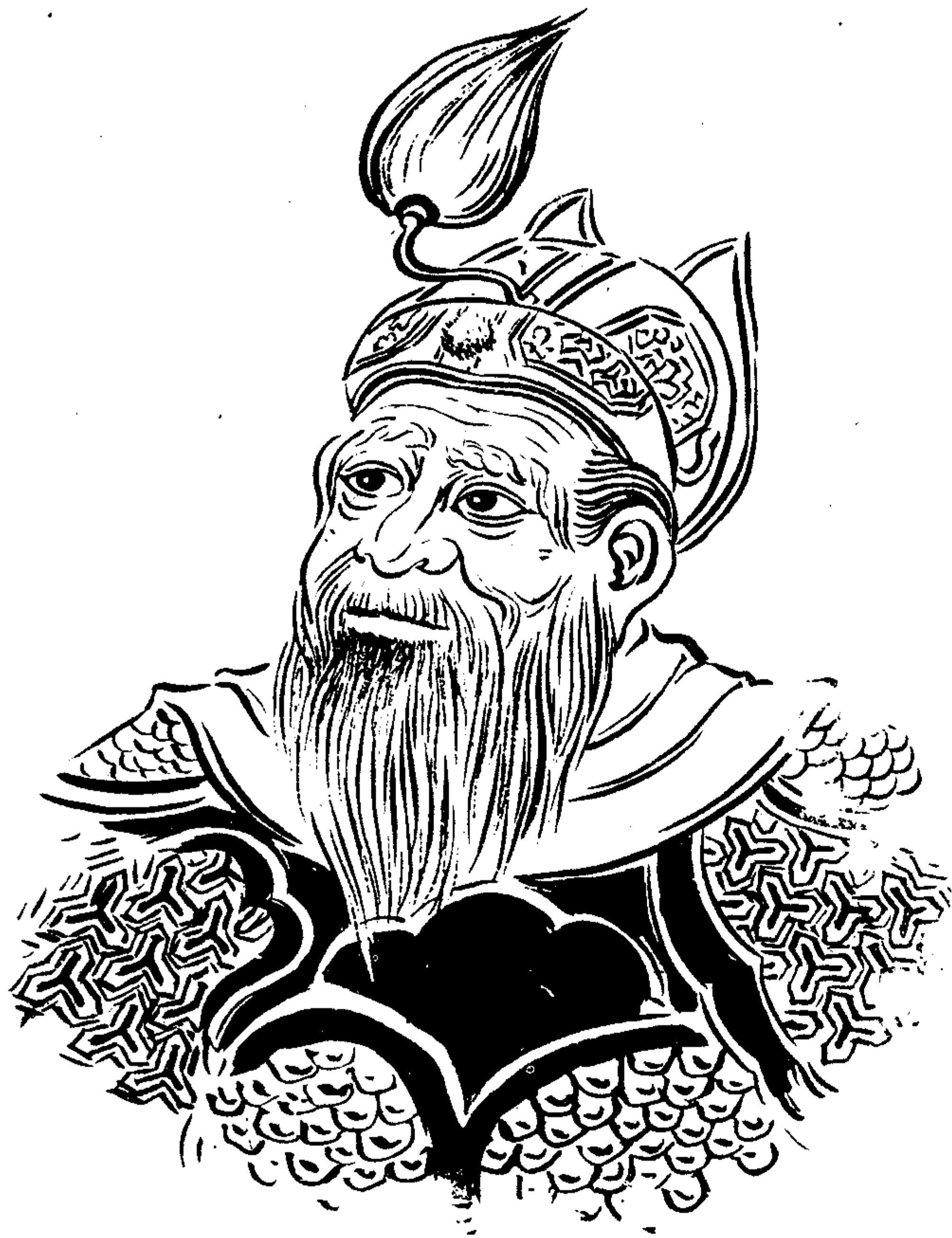
宋太尉杨业令公像