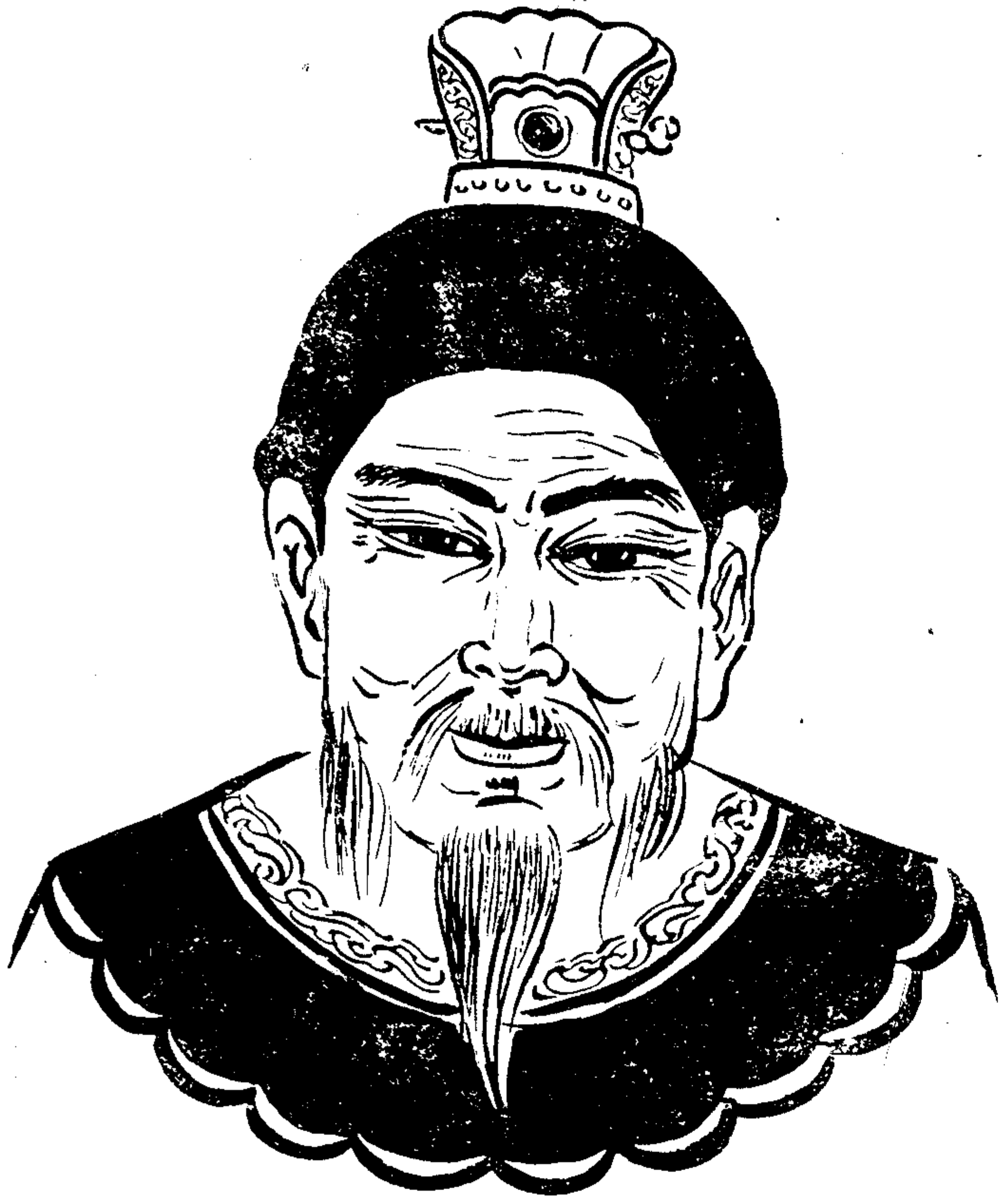
杨姓肇姓始祖村公像