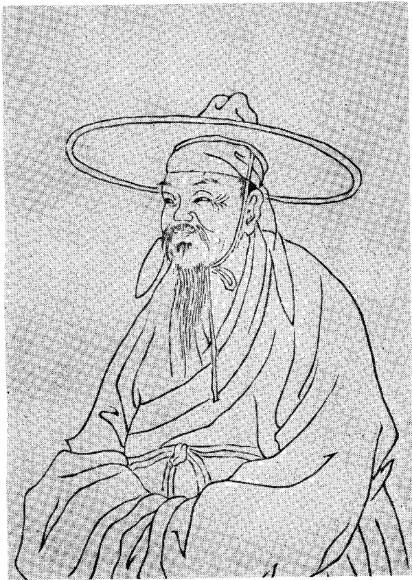
陆 游 像