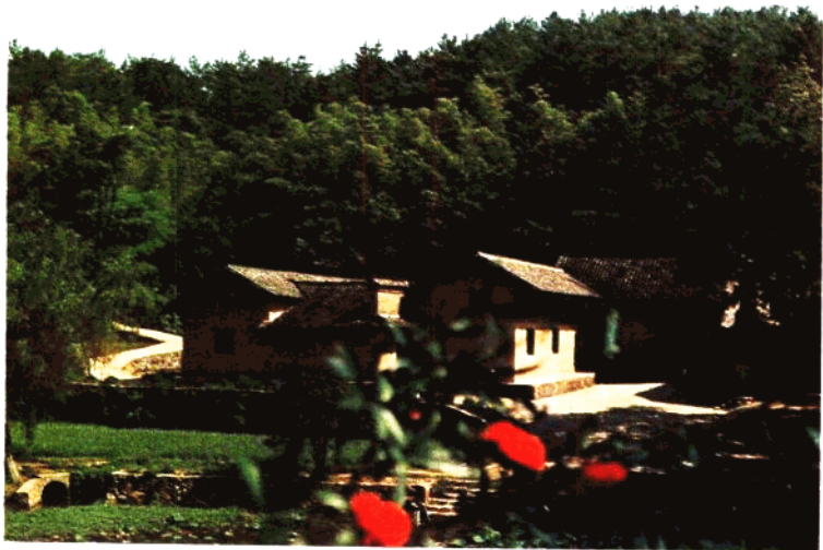
毛泽东同志故居——韶山冲上屋场