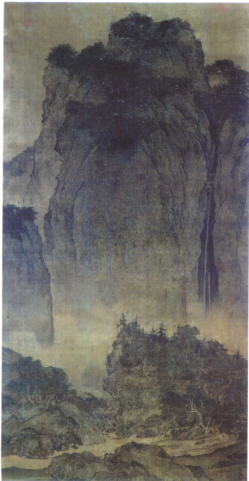
溪山行旅图 宋 范宽