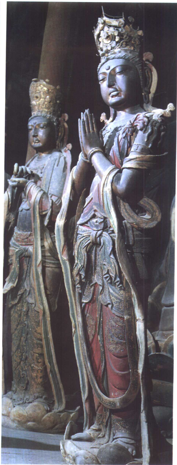
菩萨塑像 辽 山西大同下华严寺