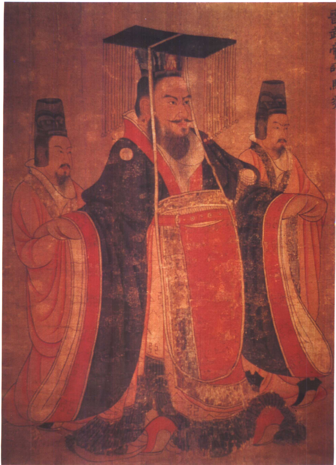
历代帝王图(部分) 唐 阎立本