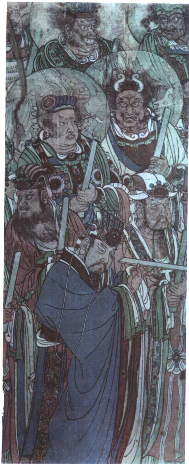
永乐宫三清殿壁画诸天神众(局部) 元 山西 永济