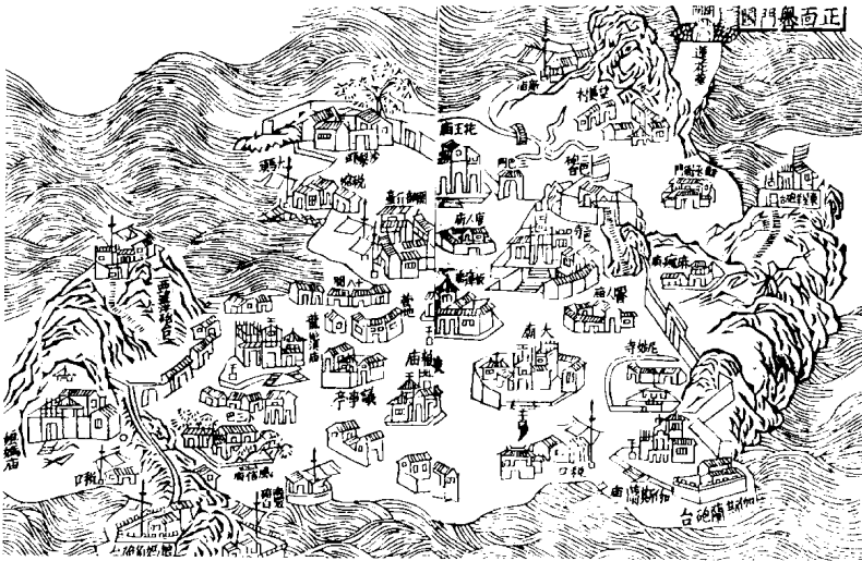
正面澳门图（《澳门记略》附图）