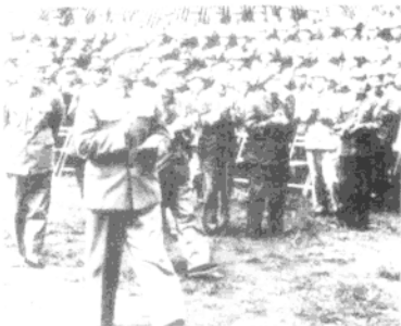
1966年，徐向前接见参加广东省军区民兵代表会议的代表 ▶