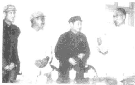
◀ 徐向前在青岛同民兵英雄交谈。右二是杨得志。