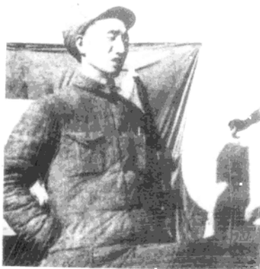
◀ 1943年3月，徐向前任抗日军政大学校长时，在给学员作报告