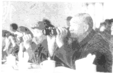
徐向前观看射击表演