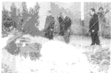
1990年10月18日，江泽民、杨尚昆、李鹏参加徐向前遗体火化仪式