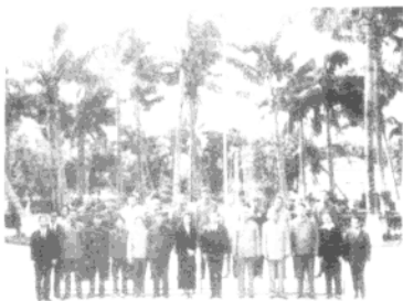
1973年11月，徐向前陪同西哈努克亲王访问海南