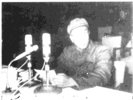
◀1966年11月13日，徐向前对军队院校和文体单位来京人员讲话