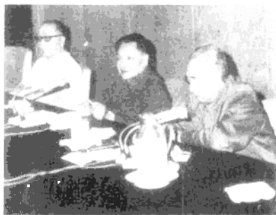
1978年，徐向前在军委座谈会上讲话 ▶