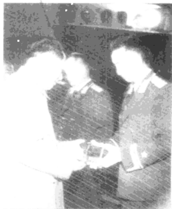
1955年9月27日，毛泽东给徐向前等授勋 ▶