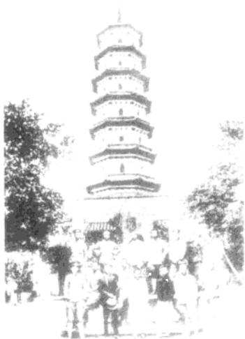
▲ 1924年底，徐向前（后排左一）在广州六榕寺与黄埔同学留影