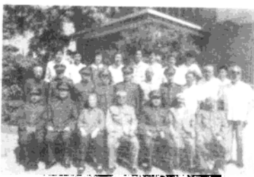
1986年6月18日，徐向前与部分红四方面军老战士合影