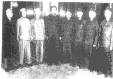
1966年8月18日，毛泽东主席在天安门和部分老同志合影，右一是徐向前