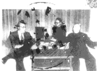
◀1980年1月6日，徐向前会见并宴请来访的美国国防部长布朗