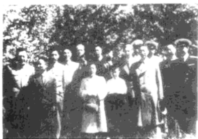
1951年5月，徐向前（前排右二）率中国政府兵工代表团出访苏联，与代表团成员在中国驻苏大使馆内合影