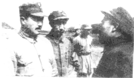
1944年，徐向前（右二）在延安机场与朱德（右一）、贺龙在一起 ▶