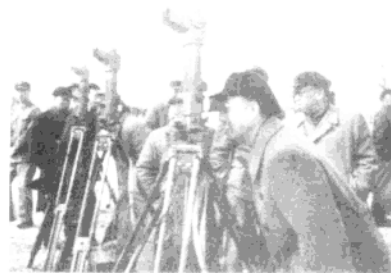
◀ 1959年10月，徐向前等视察炮兵部队某部