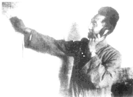
▲ 徐向前总指挥晋中战役