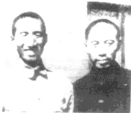
▲ 抗战前夕，徐向前与周恩来在西安办事处合影