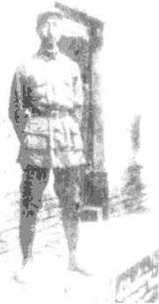
▲ 1937年5月，徐向前在西安