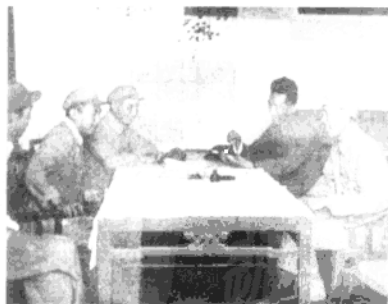
▲ 1948年6月，徐向前（右二）任华北野战军第一兵团司令员兼政治委员时，在作战室研究战况