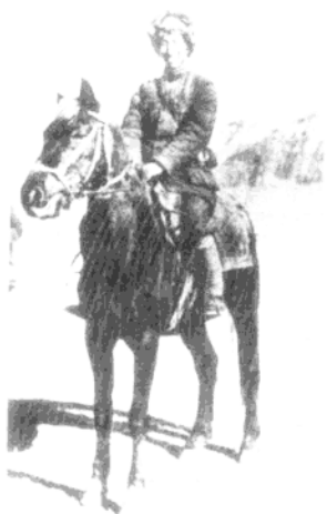
▲ 1941年春，徐向前在延安。坐骑是伏击日军时缴获的