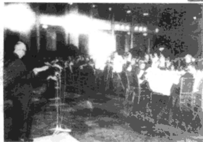
◀1979年7月31日，国防部长徐向前在人民大会堂主持八一招待会