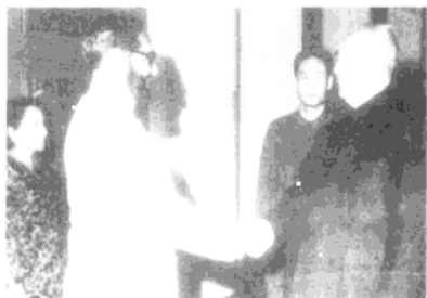
1978年4月24日，徐向前在人民大会堂会见巴基斯坦海军参谋长夏里夫上将 ▶