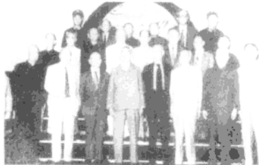
1984年，黄埔军校同学协会会长徐向前（中）与副会长、理事合影