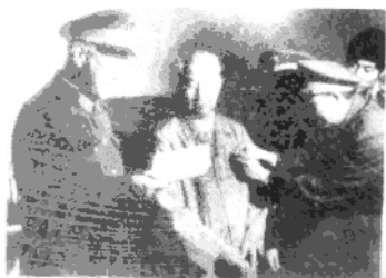
1988年7月31日，洪学智代表军委向向前授勋章