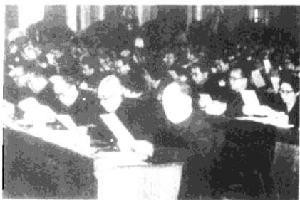
◀ 1985年12月21日，徐向前在广州军区接见广州军区党代会代表