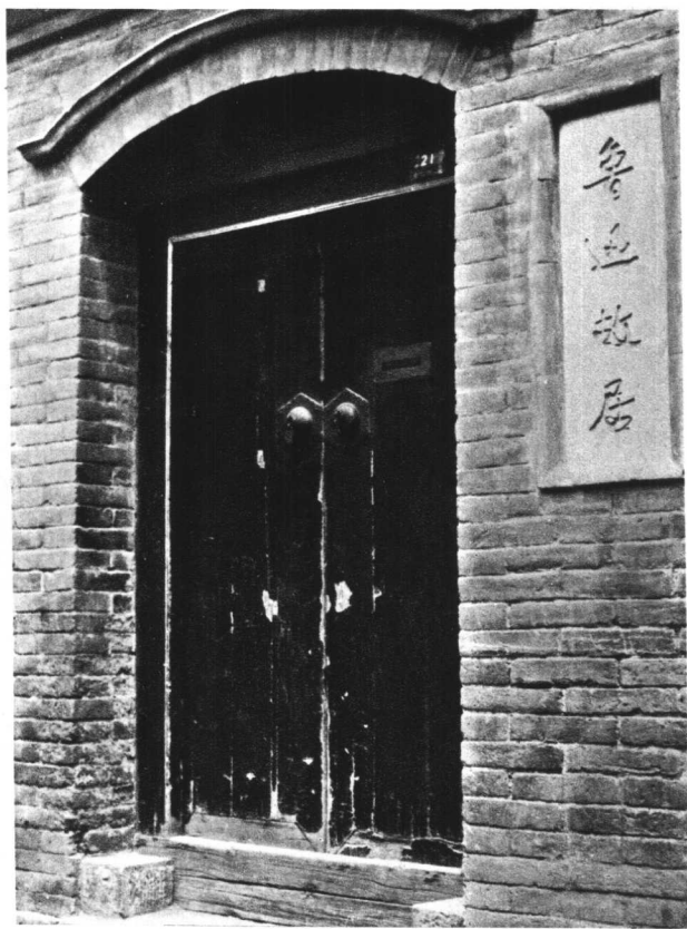
北京西三条寓所外景