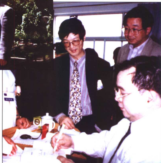
▼ 面对要求签名的读者