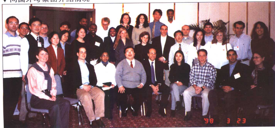
▼ 向国外考察团介绍情况