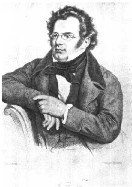
舒伯特(F. P. Schubert, 1797-1828)