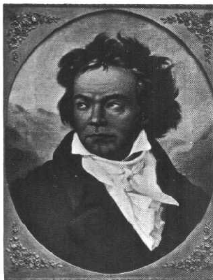
貝多芬(L. Beethoven, 1770-1827)