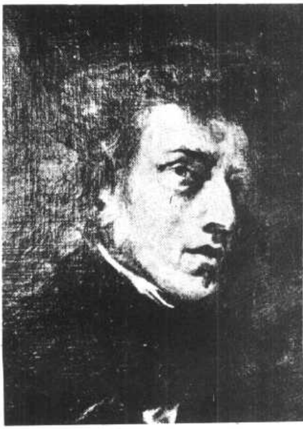
蕭邦(F. F. Chopin, 1810-1849)