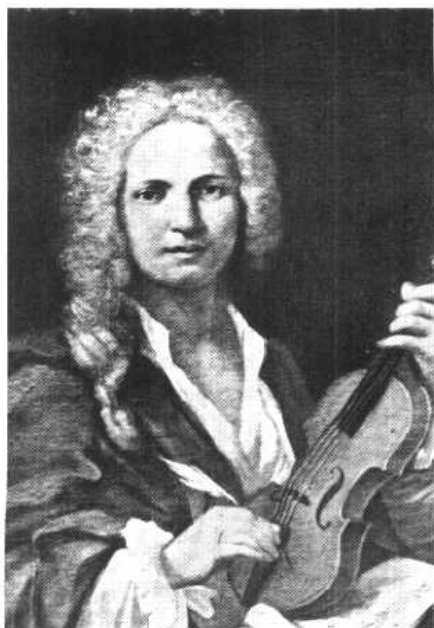
維瓦第(A. Vivaldi, 1675-1741)