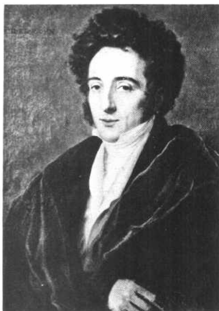
孟德爾遜(F. B. Mendelssohn 1809-1847)