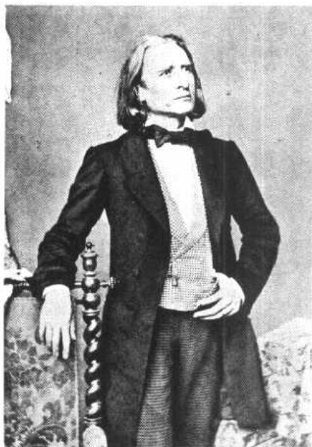
李斯特(F. Liszt, 1811-1886)