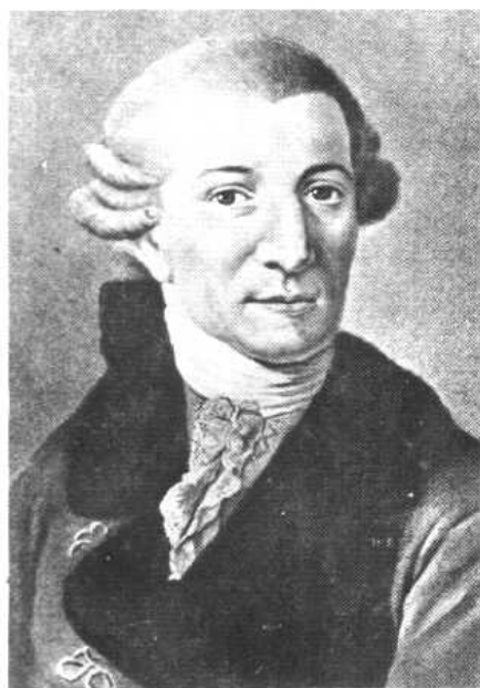
海頓(F. J. Haydn, 1732-1809)