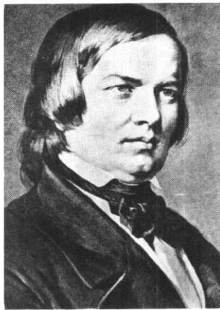
舒曼(R. A. Schumann, 1810-1856)