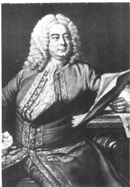
韓德爾(G. F. Händel, 1685-1759)