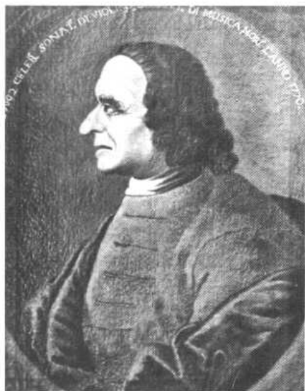
塔蒂尼(G. Tartini, 1692-1770)