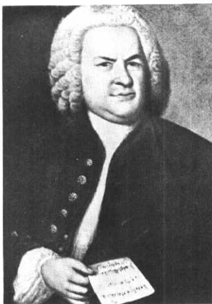
巴哈(J. S. Bach, 1685-1750)