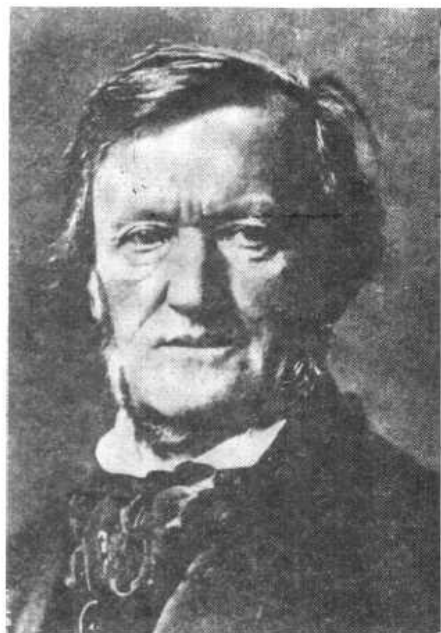
華格納(R. Wagner, 1813-1883)