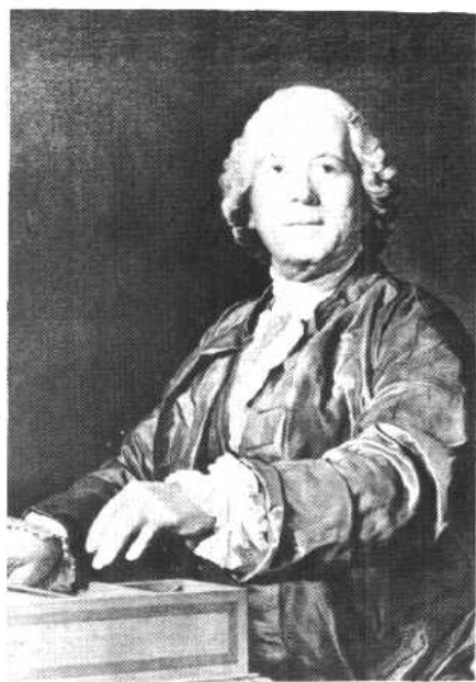
葛魯克(C. W. Gluck, 1714-1787)