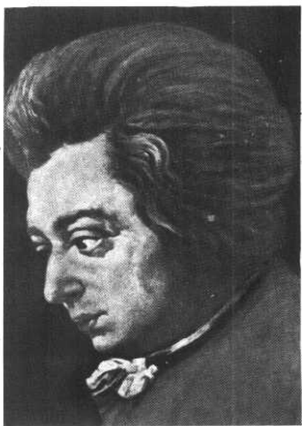
莫札特(W. A. Mozart, 1756-1791)