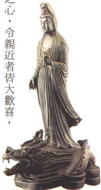
觀音菩薩（黃映浦贈）

4. 同事攝：是乃隨順行。如菩薩以「大慈大悲，救苦救難」的願力示現無量身形入諸六道，令衆生在黑暗裡見到光明，在無助中得到幫助，在徬徨時得到依靠，在苦難時得到救濟。