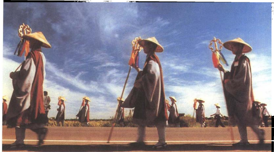
■行腳（佛光山叢林學院）