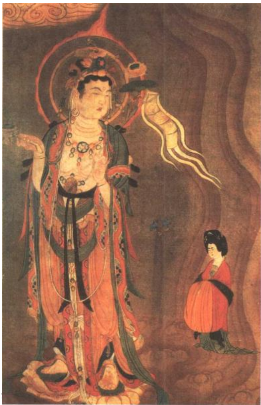
■引路菩薩（敦煌石窟）

載，佛陀往昔行菩薩道時，曾不惜性命「捨身飼虎，割肉餵鷹」 ③ ，以完成菩薩布施度的宏願。作忍辱仙人時，為歌利王割截肢體，以不生瞋恨而完滿忍辱之修行 ④ 。另外，如舍利弗獨自一人前往北方監造祇園精舍 ⑤ ，並勇敢地面對傲慢自高的六師外道，以神力降伏之。目犍連為維護正法的傳佈，無懼於異教徒的伺機迫害，終於為教殉難 ⑥ 。富樓那到西方輸盧那國教化粗獷的人民，只為佛法可以興隆，犧牲生命，亦在所不惜 ⑦ 。摩訶男自沈於水，以救族人，乃至須達多、梨師達多舉所有資產以為供養、布施等，這一切都要靠菩提心發起的力量，才能有此大願大行。