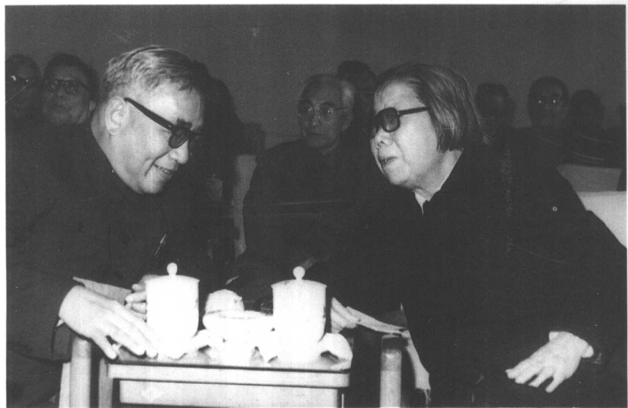
与邓颖超同志合影