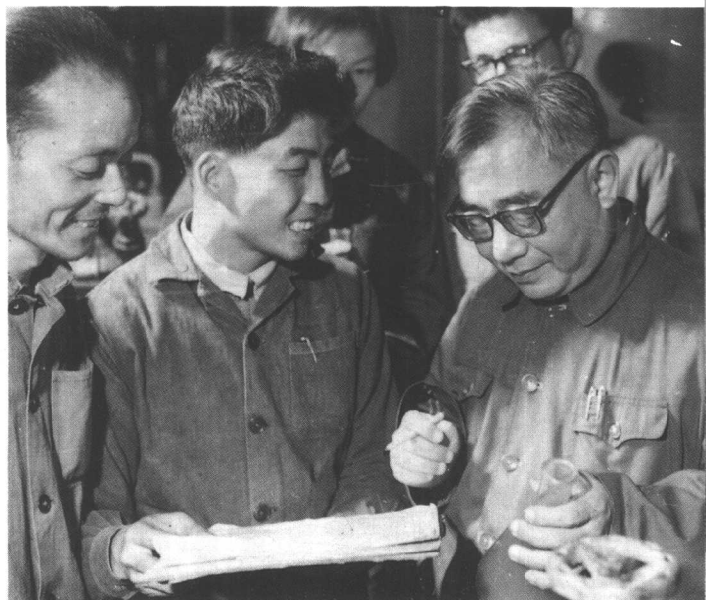
带领福州大学化学系师生下厂搞科研（1972年）