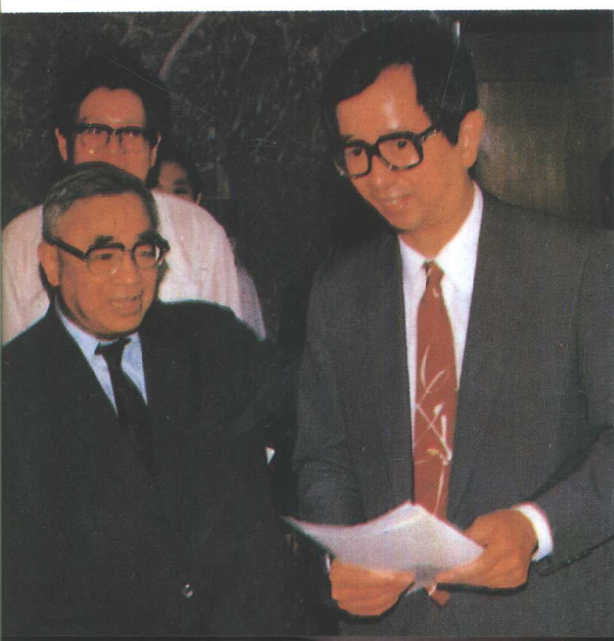
与李远哲教授合影