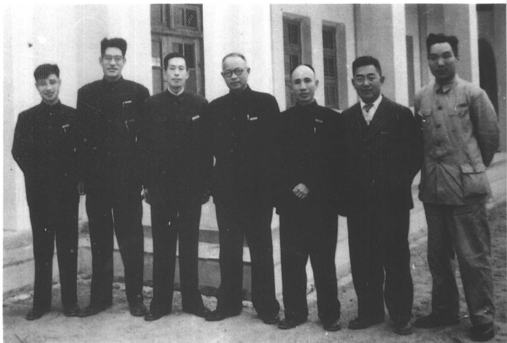
与厦门大学领导合影（50年代）