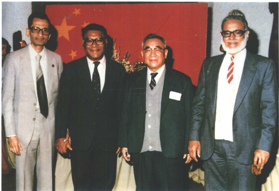
1986年应印度国家科学院院长的邀请 参加印度科学院成立50周年纪念