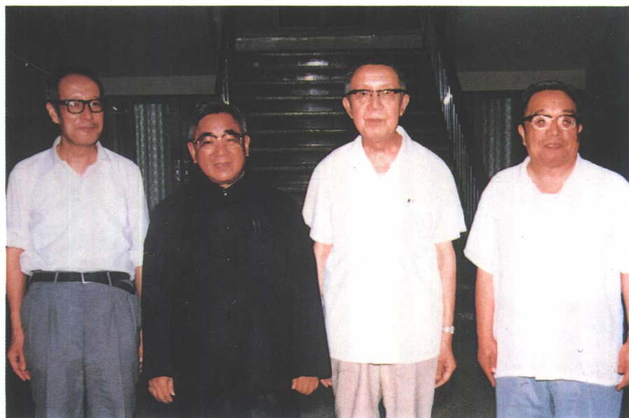
与吴征铠、唐敖庆、徐光宪合影