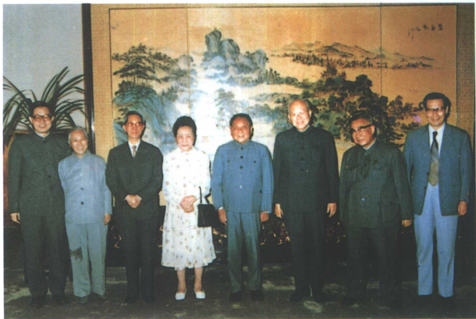
陪同邓小平会见著名物理学家 美籍华裔吴健雄、袁家骝夫妇（1984年9月）