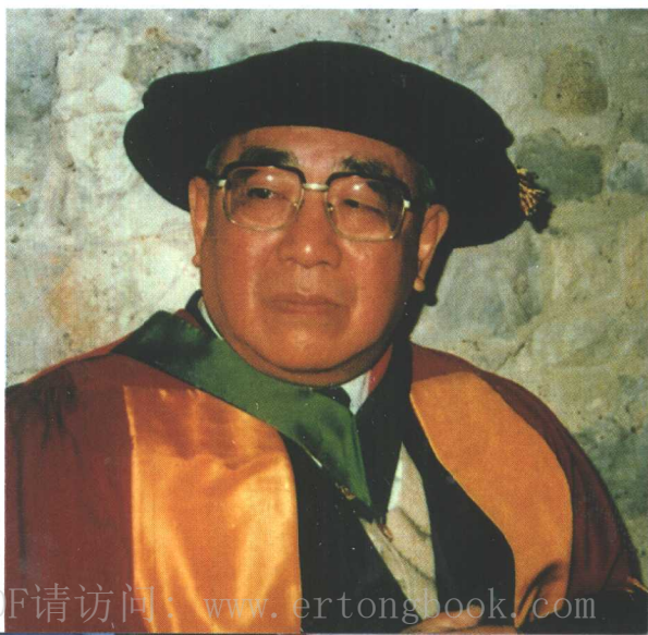
1987年11月接受英国伦敦大学 授予名誉科学博士学位