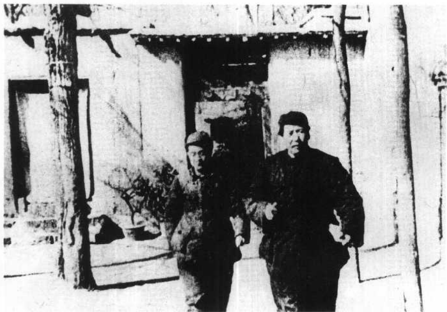
中共七届二中全会期间， 毛泽东和胡乔木在一起