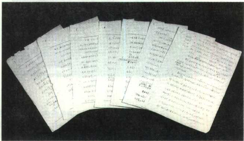
胡乔木为《苏德战争和中国政局》拟定的详细提纲手稿