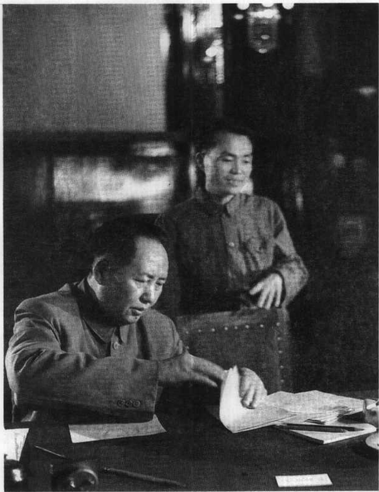
1950年6月29日毛泽东与胡乔木 在中央人民政府第八次会议上