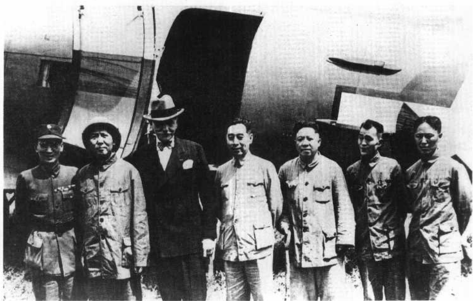
1945年8月毛泽东赴重庆谈判，胡乔木（右二） 随同前往。这是在延安机场上的合影。