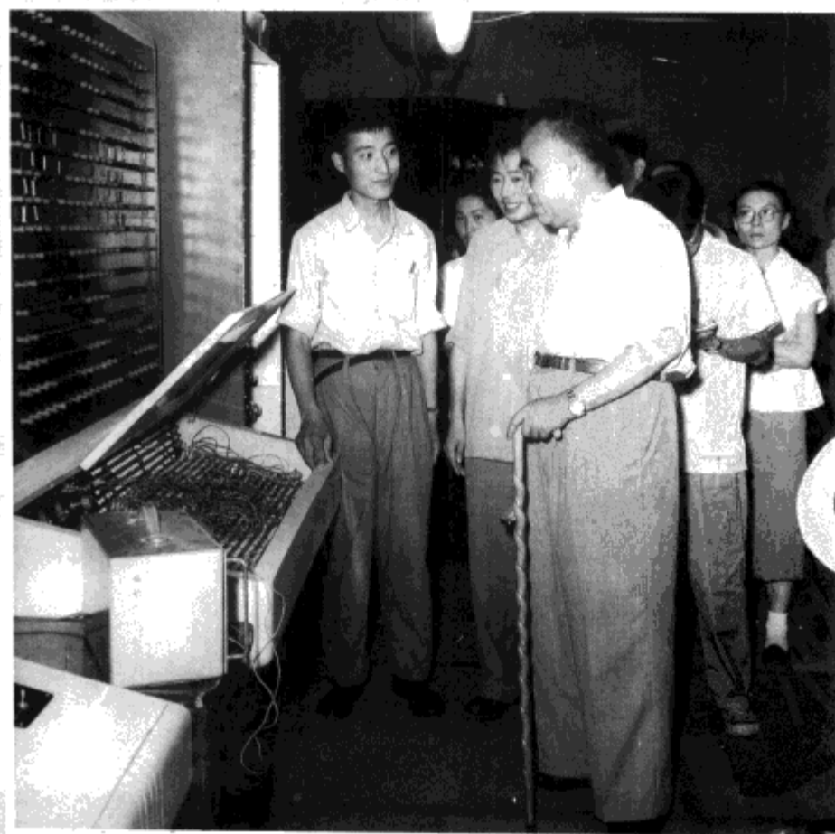
1960年6月，全国人大常委会委员长朱德视察合肥工业大学