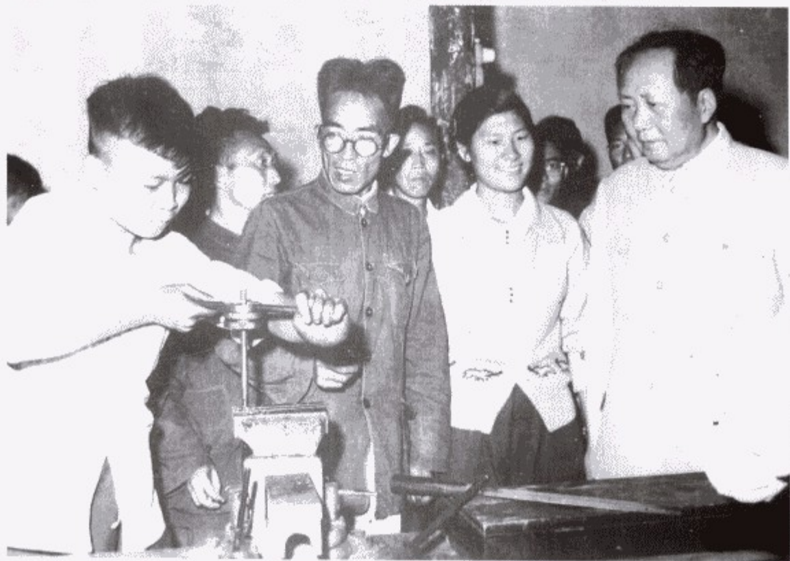
1958年9月16日，中共中央主席毛泽东视察安庆一中时观看学生在校办工场操作