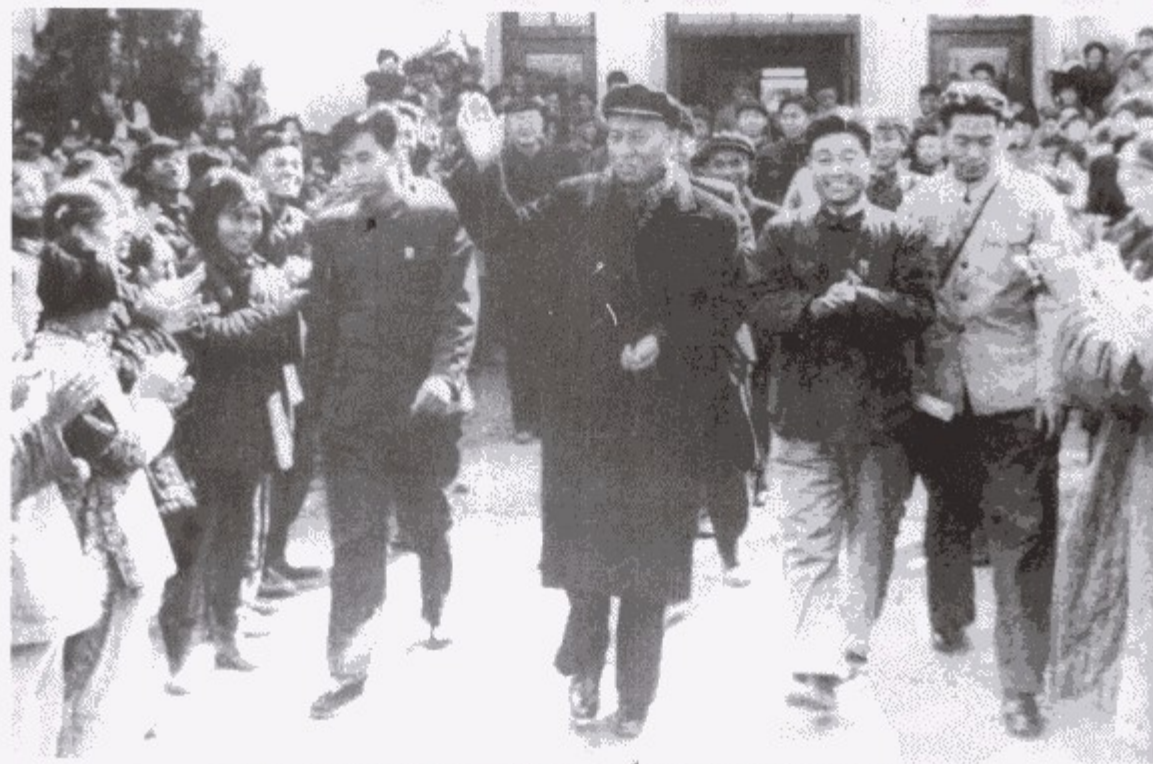
1958年10月17日，国家主席刘少奇视察蚌埠三中