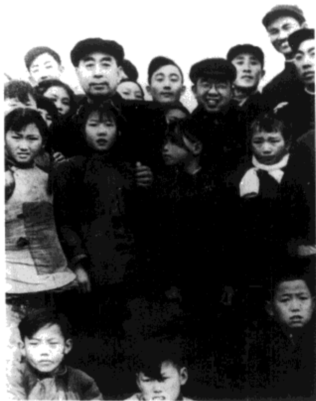
1958年1月，国务院总理周恩来 由省委第一书记曾希圣陪同视察肥西 县肥光小学和师生合影