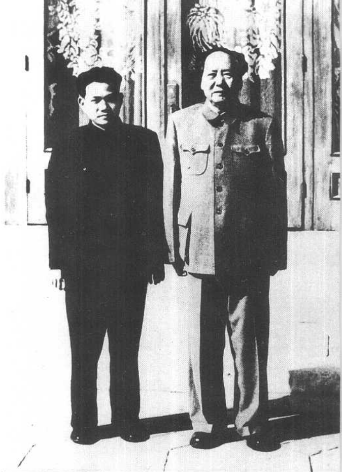
毛泽东与本书 作者李银桥。