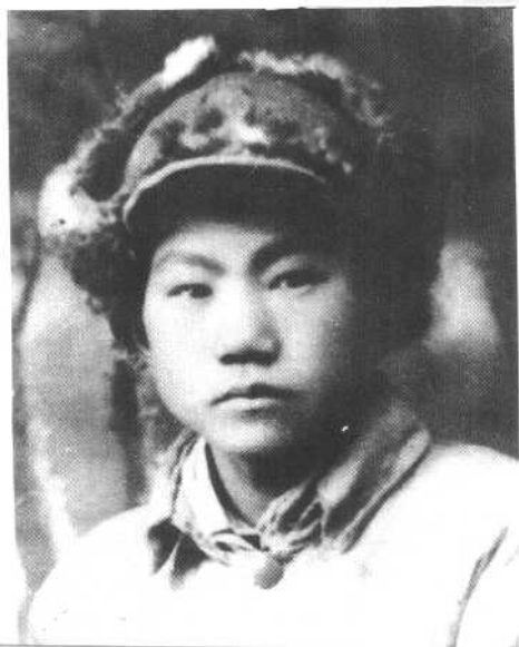
解放战争初期的李银桥。