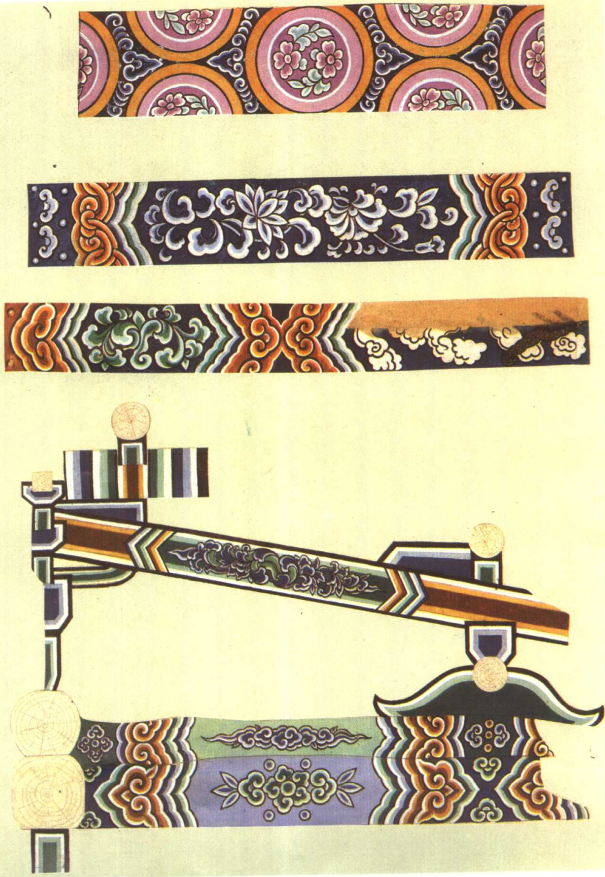
上：新绛县光马村白台寺宋代彩画 中、下：洪洞县广胜下寺大殿元代彩画