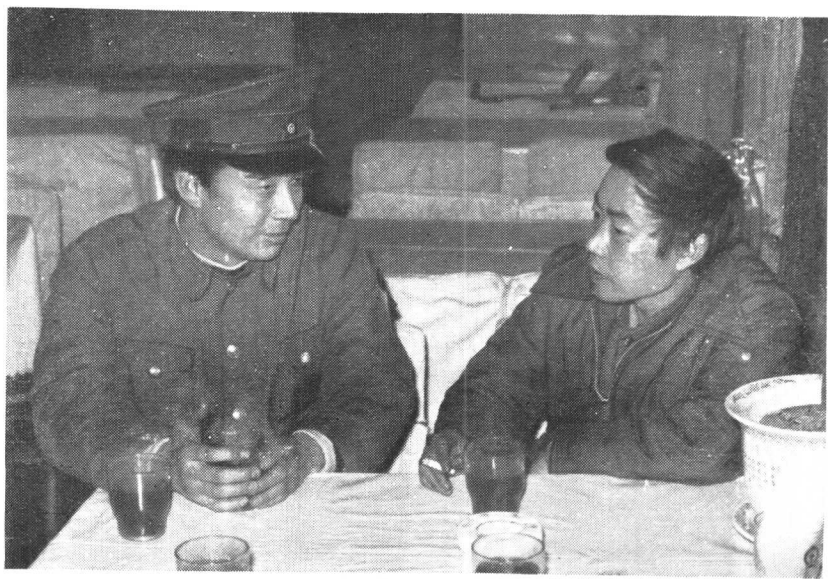
在列车上与乘务员交谈