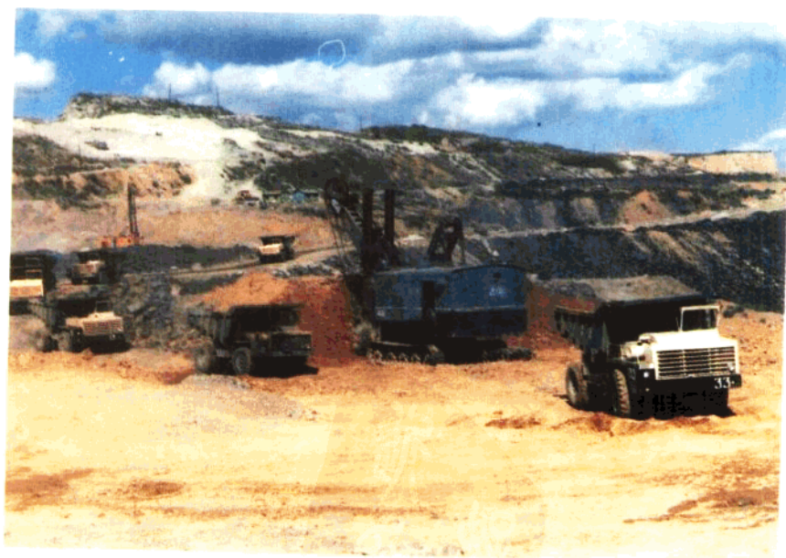
昆阳磷矿二采区工作面