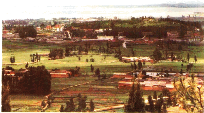
山明水秀的晋宁县城昆阳镇