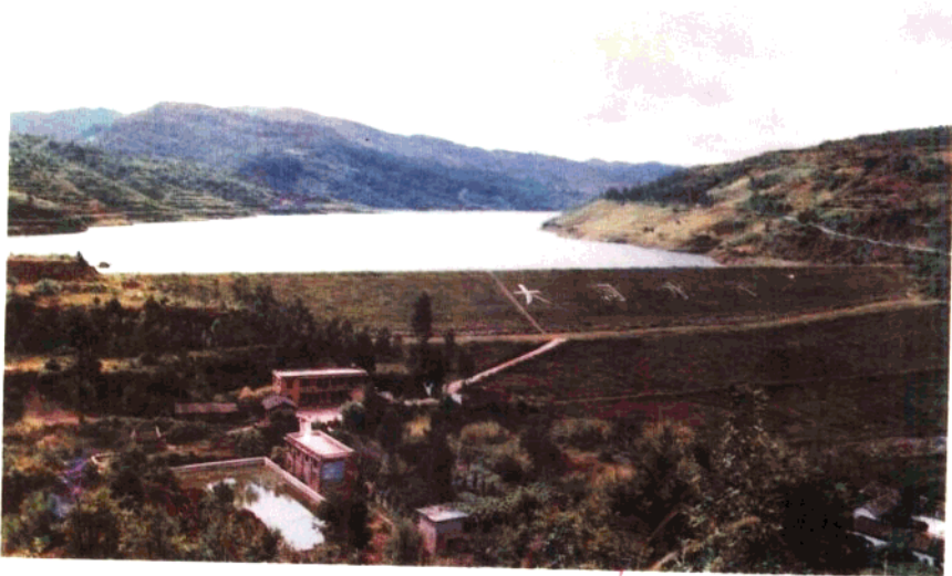
山明水秀的大河水库