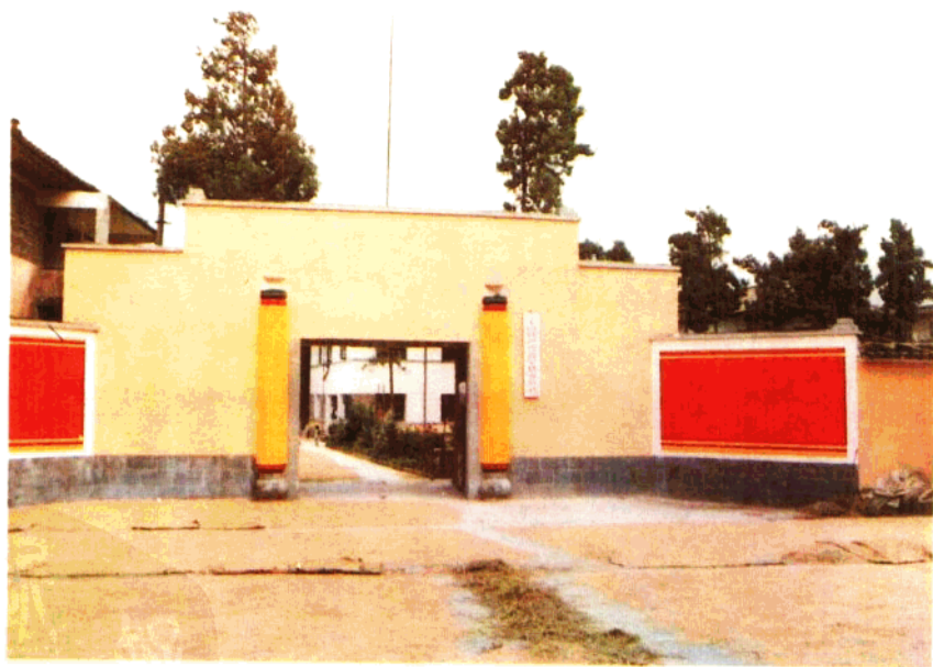
中共晋宁县委员会