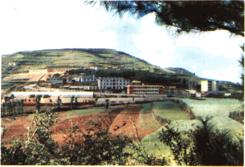
晋宁磷矿