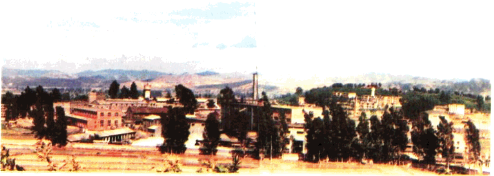
云南轮胎厂 轮胎厂宣传科供稿