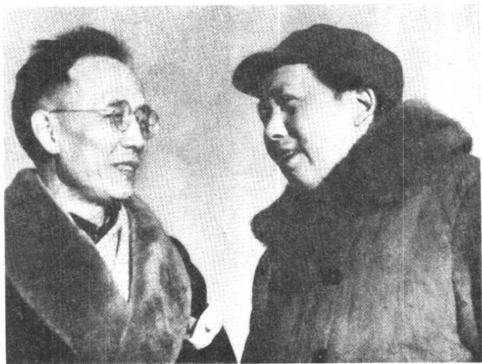
一九四九年三月二十五日在西苑机场迎接党中央和解放军总部迁至北平时，同毛泽东在一起交谈。