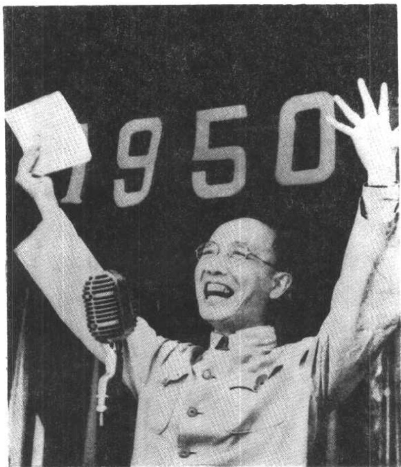
一九五〇年“六一”儿童节在 北京中山公园音乐堂向儿童献诗