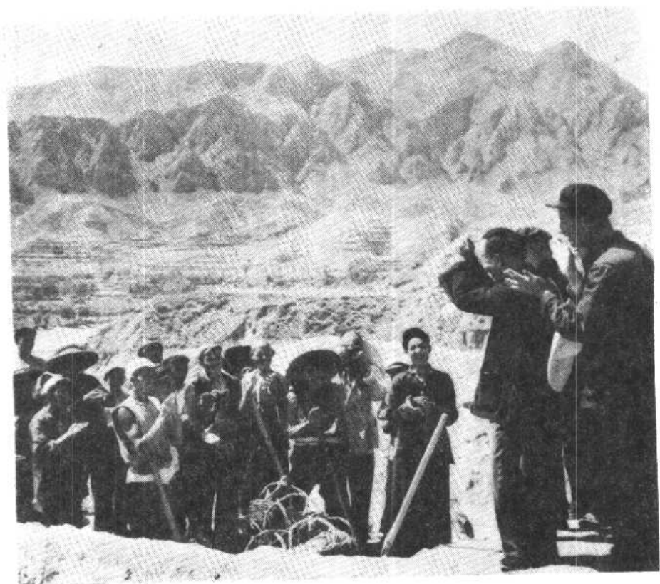
一九五八年五月参观河北怀来县花园乡时摄