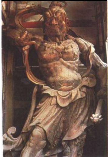
■金剛力士（日本南大門）