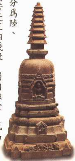
■東印度出土舍利塔（11世紀）

7 《十住毗婆沙論·易行品》記載的佛國淨土及佛名：(一)東方無憂世界善德如來；(二)南