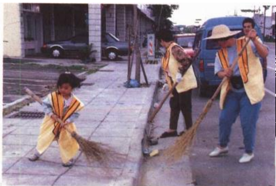
勤勞、整潔可自利利人

一、習慣：佛教說煩惱難斷，而去除習氣 ① 更難。習慣本是吾人生活的固定模式，有好有壞，而經年累月後，習慣成爲自然，就會變成根深蒂固的習氣，生生世世難以消除。因此，對於習慣的養成，必須謹慎。壞的習慣如抽煙、吸毒、酗酒等，損害身體健康；說謊、濫情、慳貪等，敗壞自己的道德。好的習慣如作息正常、飲食、運動、樂觀等，可以延年益壽；勤勞、整潔、熱忱等，可以自利利人。佛教提倡信徒養成讀經 ② 的習慣，就可以藉著佛法指引迷津；養成念佛 ③ 的習慣，就可以依佛號啓發心中的佛性而往生淨土，超越生死。總之，一個人縱使有得天獨厚的優越條件，而習慣不好，也難有大富大貴的命運。好的習慣也是一種助緣，可以幫助我們化險爲夷，一帆風順。