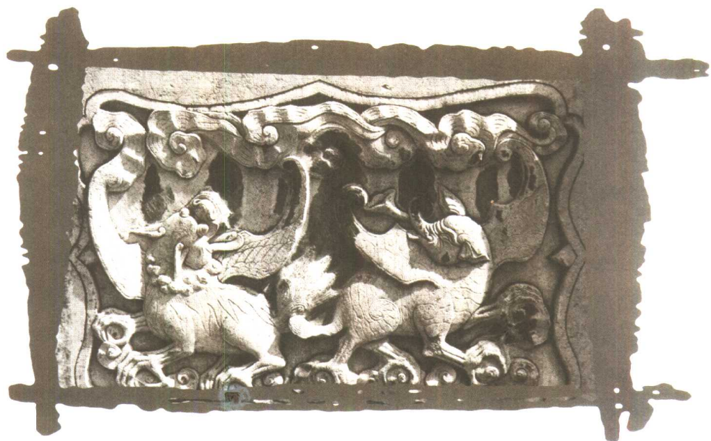
图1 建水朱家花园石栏杆神兽雕饰