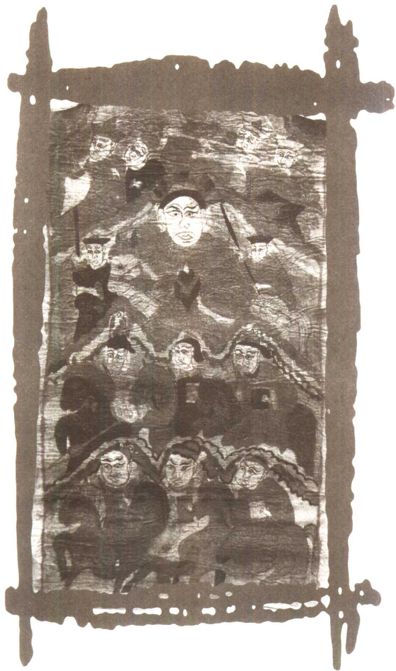
图2 瑶族道教神像画