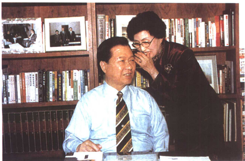
志同道合的伴侣李姬镐女士为金大中出谋划策。