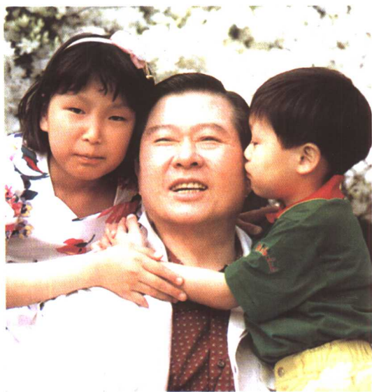
金大中正 在和孙子孙女 亲昵。