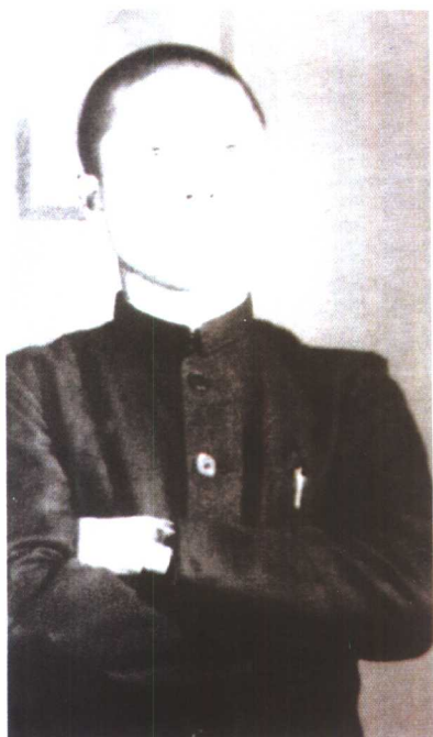
中学时代的金大中。