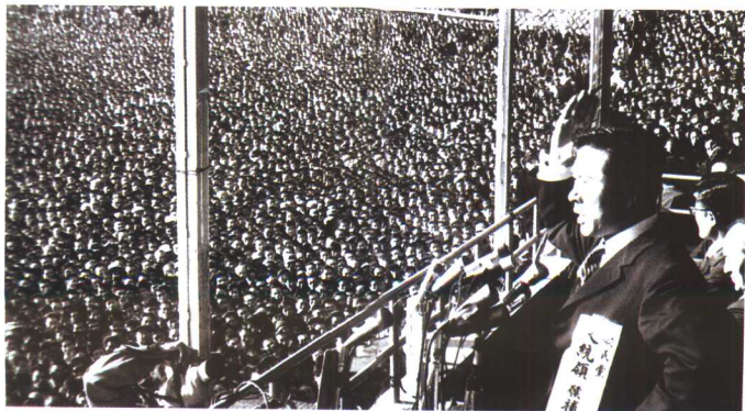
1971年总统选举中，金大中在群众集会上发表演说。