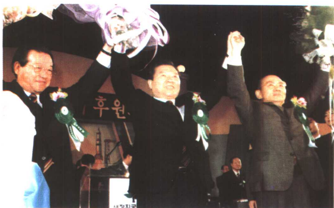
金大中与自由民主联盟名誉总裁金钟泌和总裁朴泰俊共贺赢得大选。