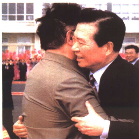
离开平壤时，金大中与金正日紧紧地拥抱。