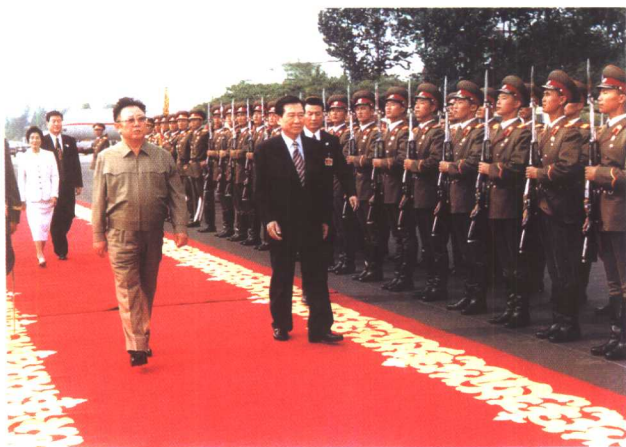
金大中与金正日检阅朝鲜三军仪仗队。