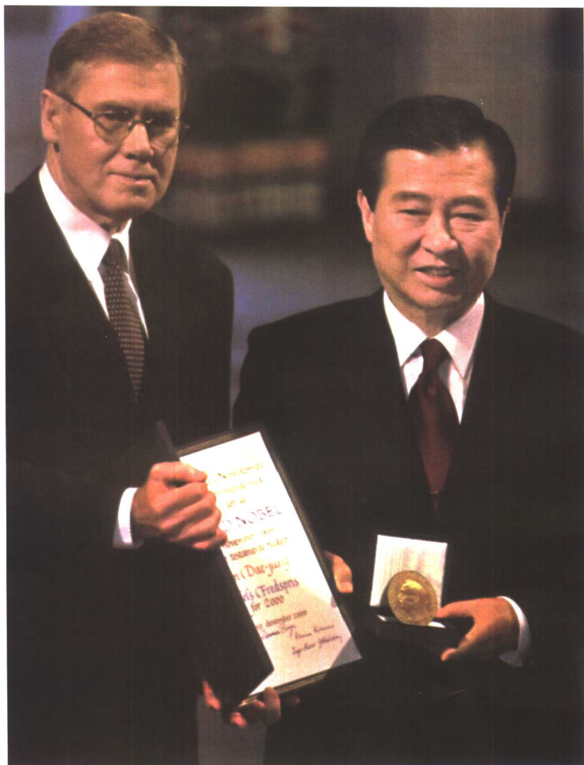
金大中荣获 2000 年度诺贝尔和平奖，成为 20 世纪最后一位诺贝尔和平奖获得者。