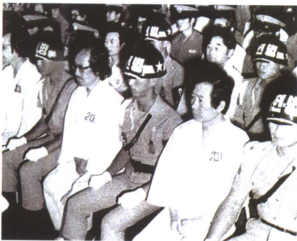
1980年全斗焕政府捏造“煽动叛乱和谋反罪”在军事法庭上审判金大中。