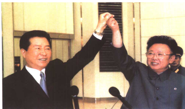
金大中与金正日携手共祝首次南北首脑会晤成功举行。