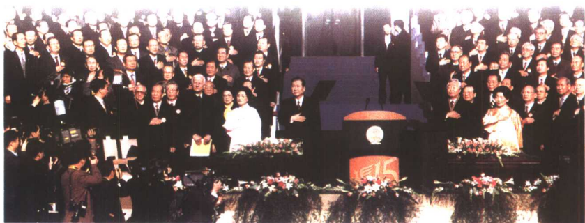
1998年2月25日，金大中和夫人在就职总统典礼上。