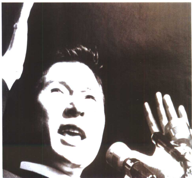
1971年总统选举中，金大中慷慨激昂。