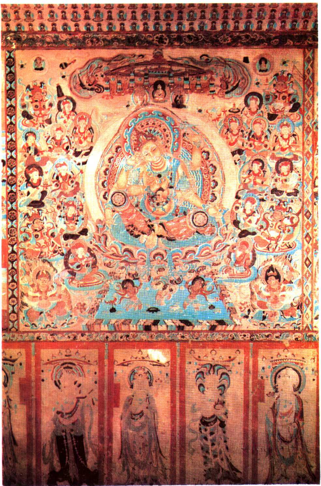
號 1413 美