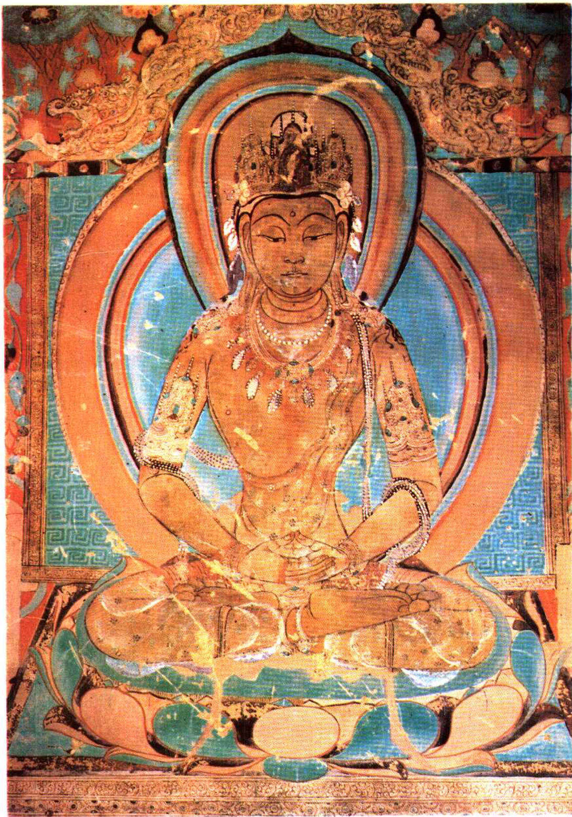
美 1414 號