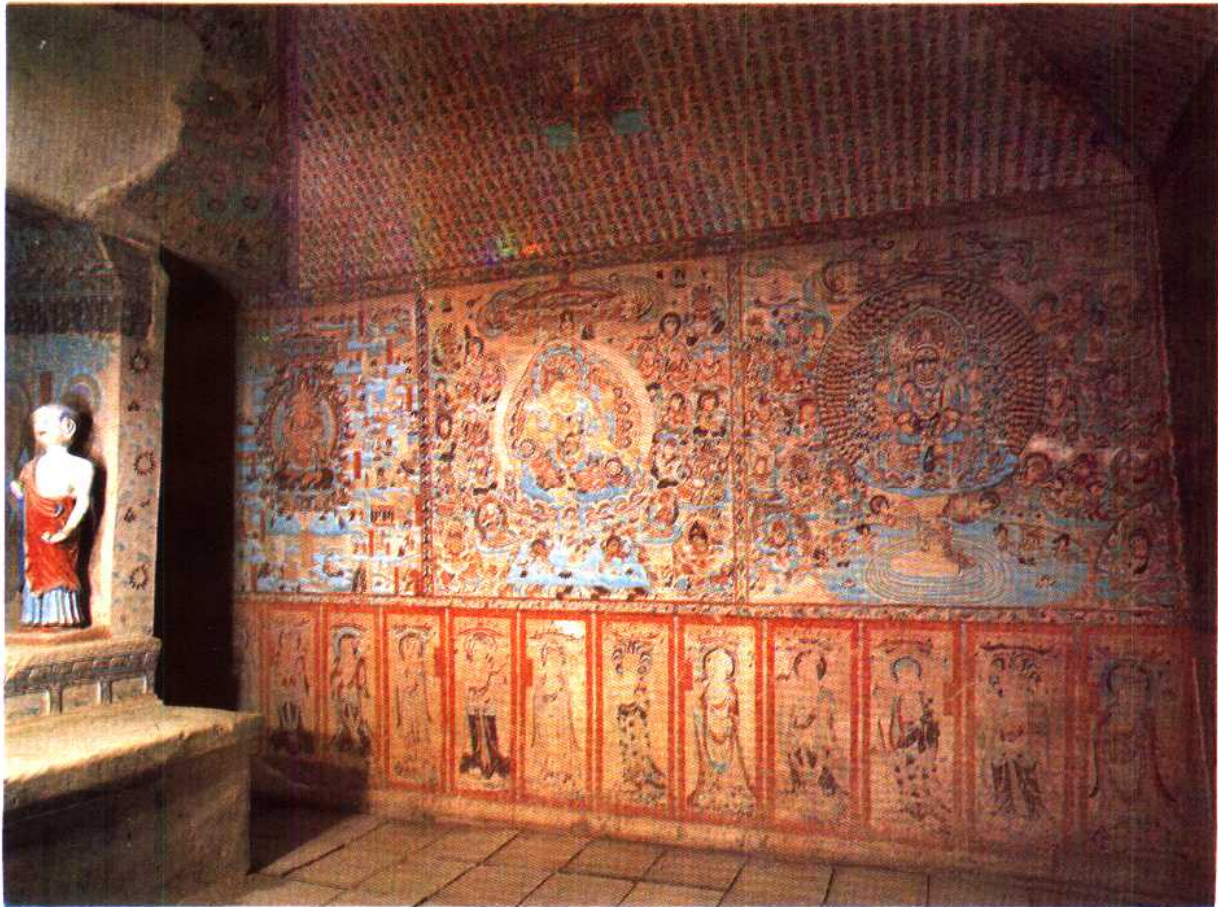
號 1412 美