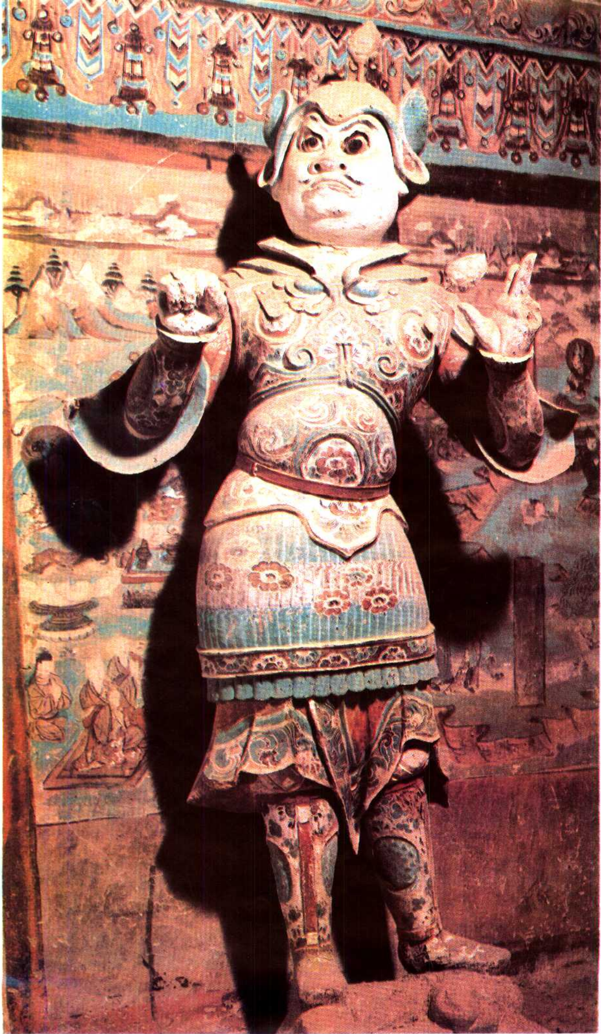
號 1408 美