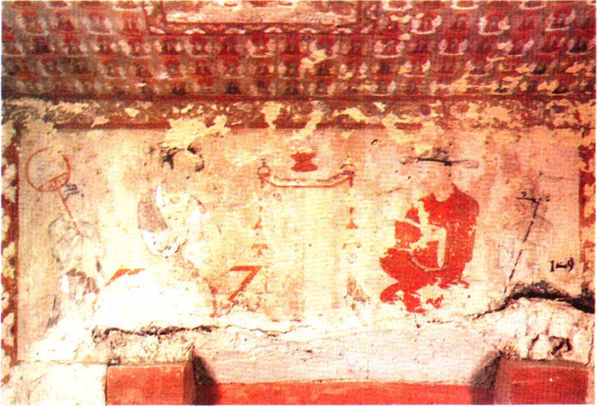
號 1411 美