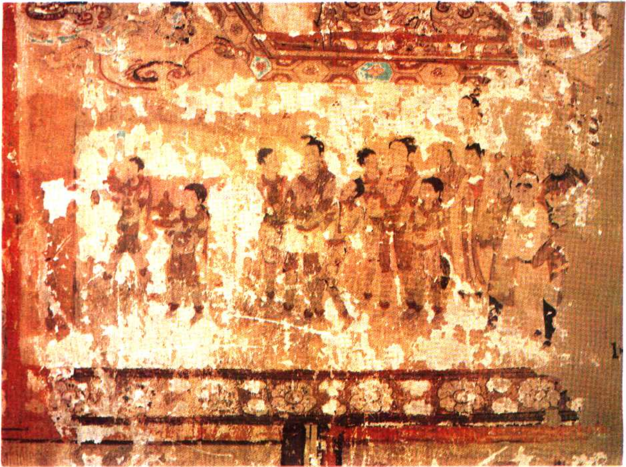
號 1410 美