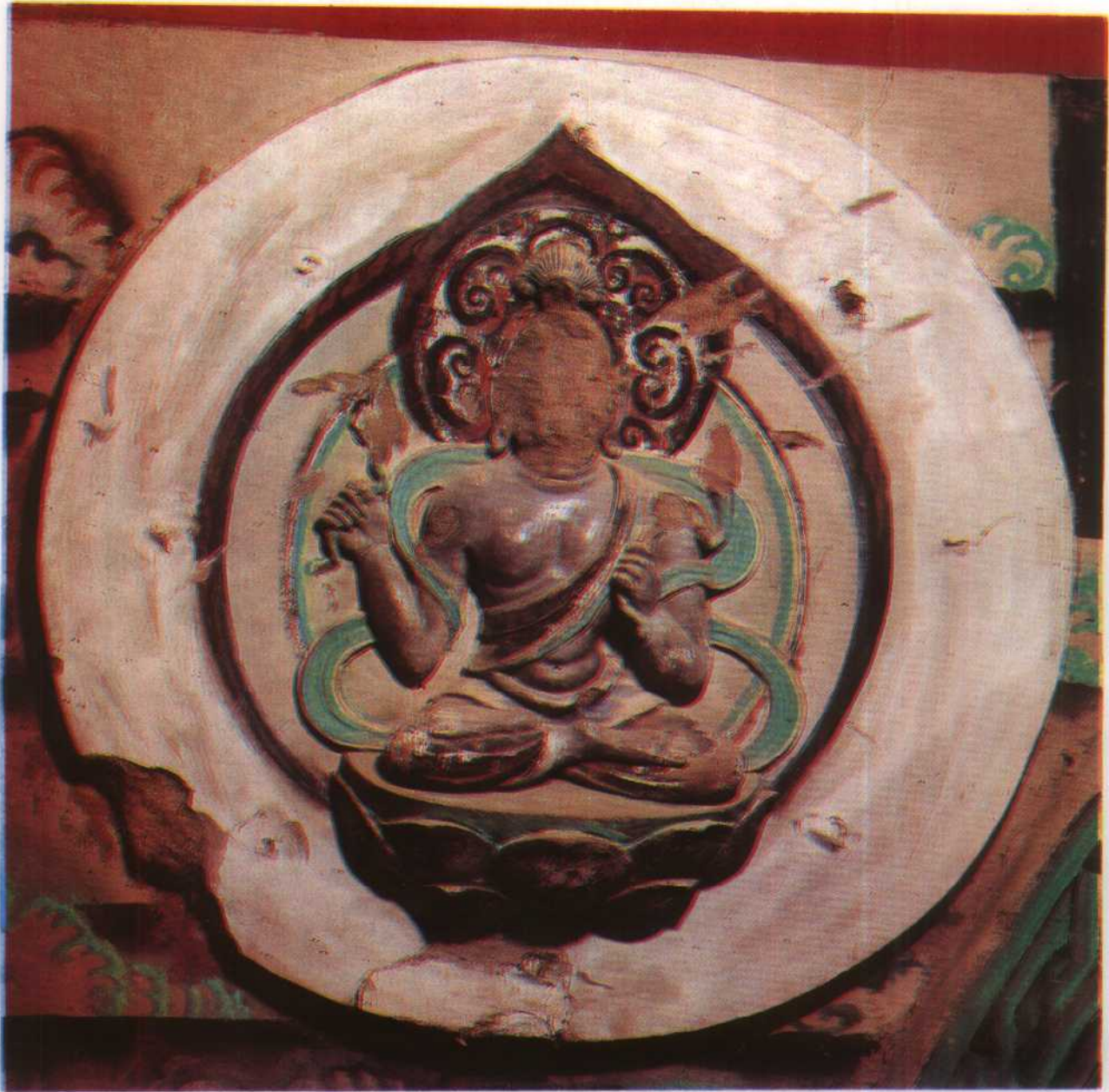
美 1303 號

藏 一 二 三 四 五 六 七 八 九 十 十一 十二 十三 十四 十五 十六 十七 十八 十九 二十