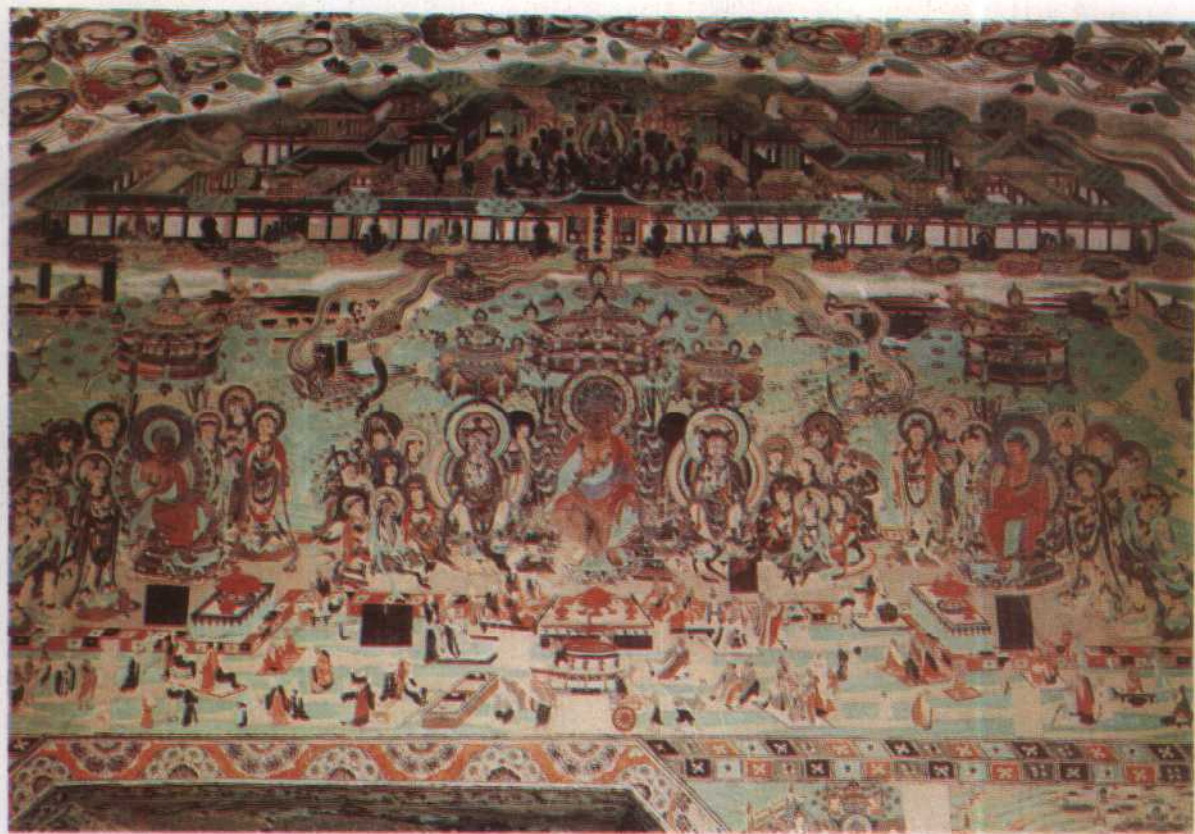
號 1298 美