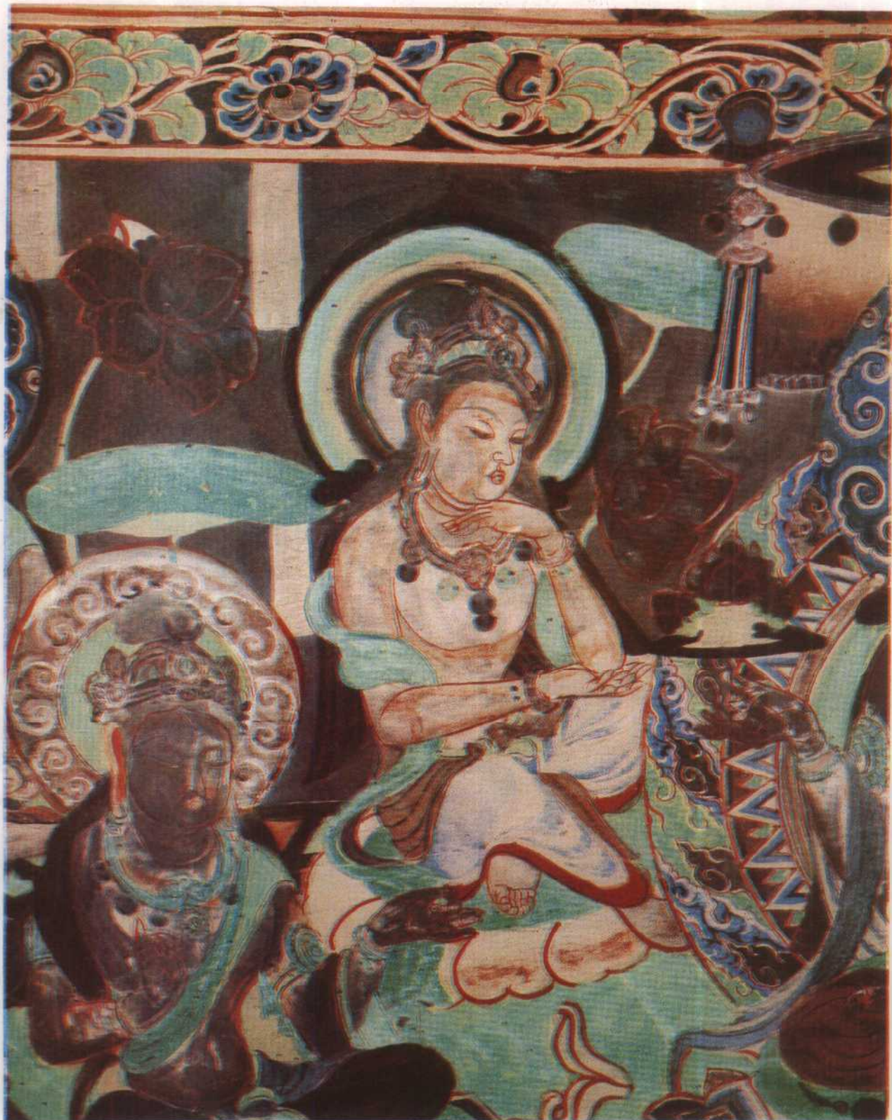
號 1301 美