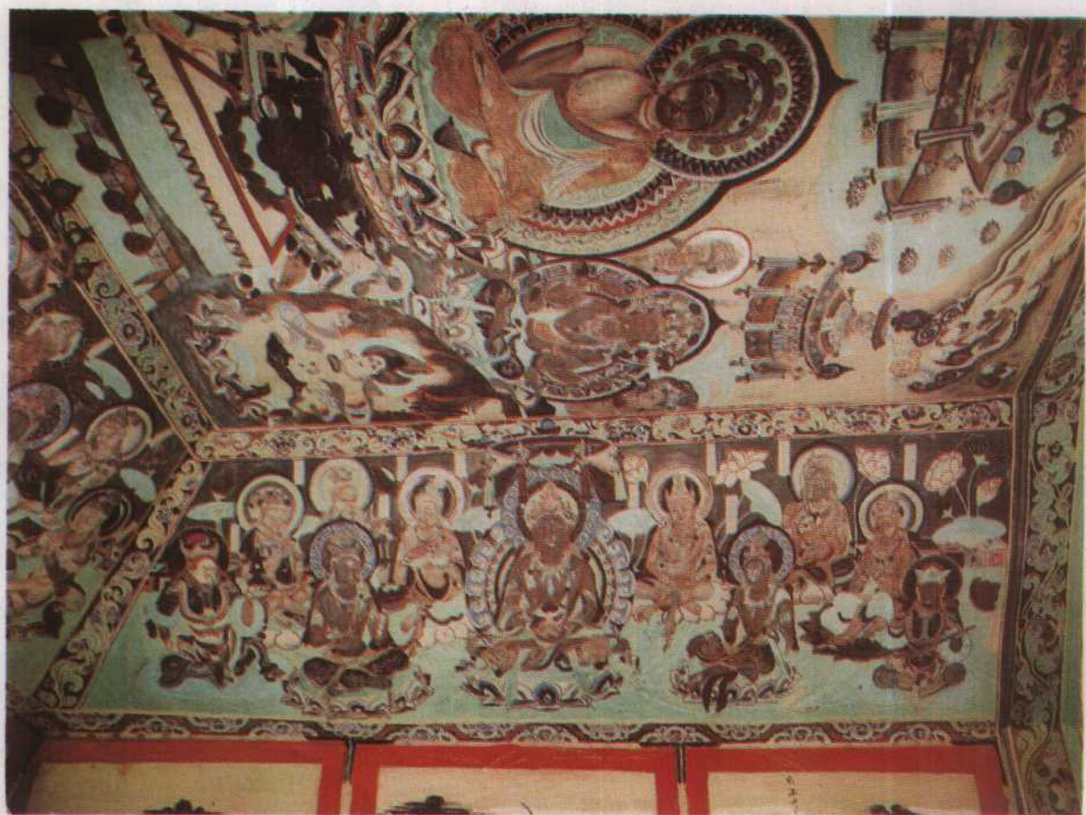
號 1299 美