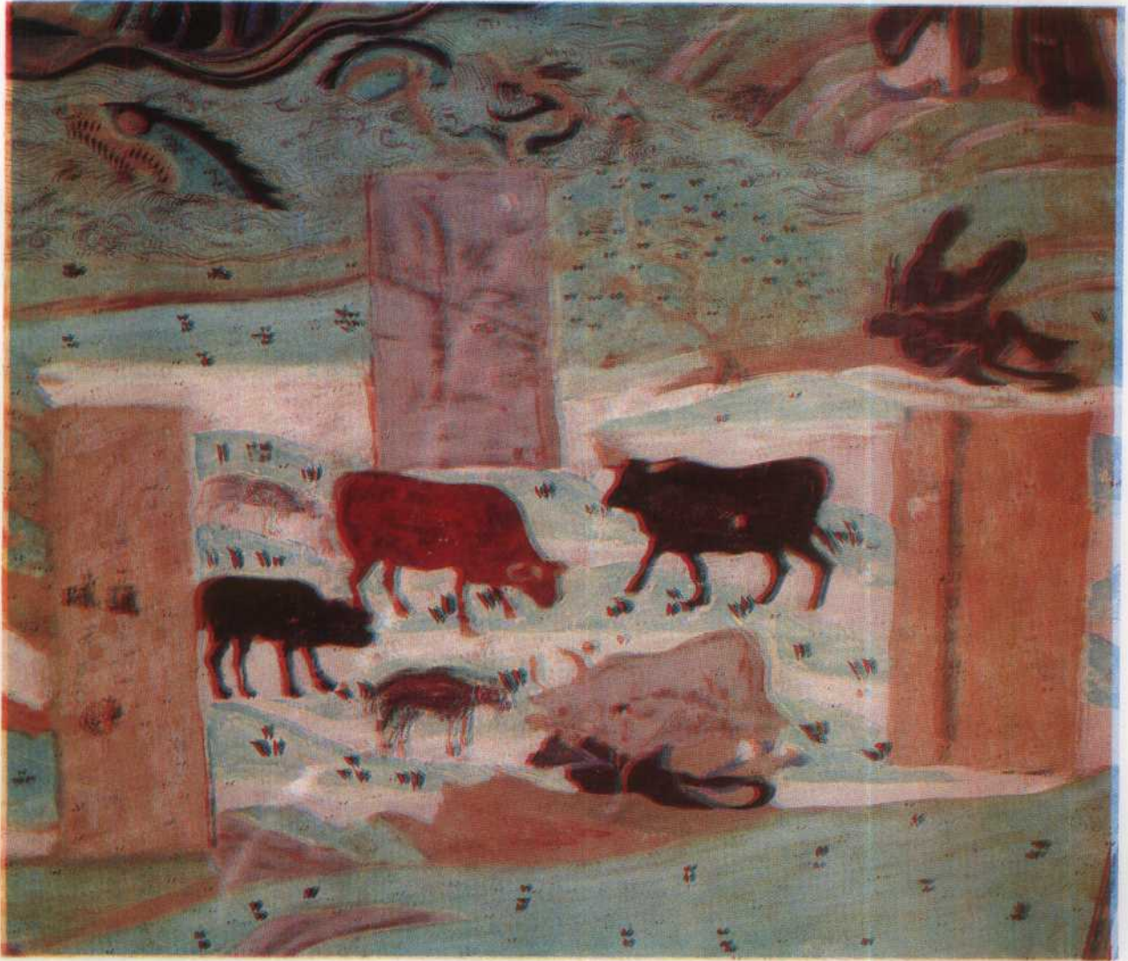
美 1297 號