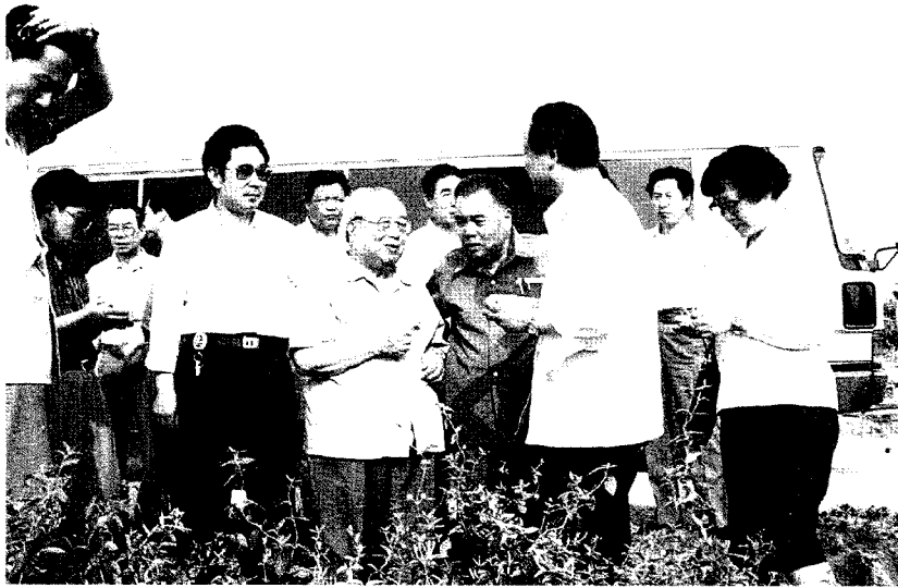
1992年5月29日，费孝通(前左二)在费县大梓萝湾村考察。前左一李祥栋，前左三刘兴武，前左四李延华。