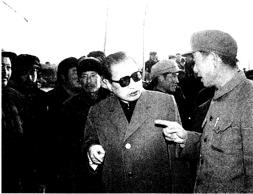
1991年1月12日，乔石(右二)在费县宁家沟村视察时了解村民生产生活情况。