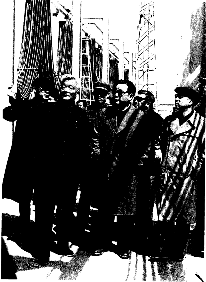
1985年4月24日，李鹏（前中）视察日照石臼港。