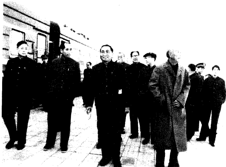
1985年11月8日，万里(前右一)视察兖石铁路临沂火车站。