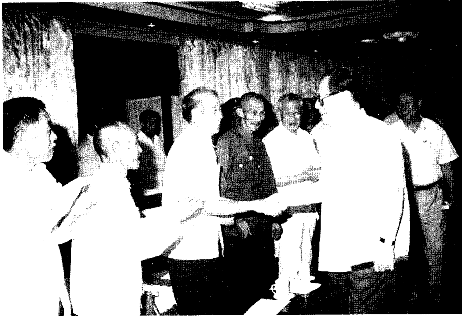
1992年7月28日，江泽民（右二）在临沂视察期间接见老党员、老干部和英模代表。右一姜春云，右三王任之。