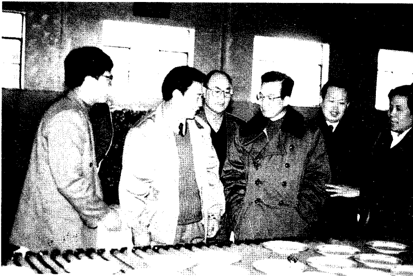
1995年1月14日，温家宝(右三)视察罗庄区沈泉庄村办企业。右二陈建国，右四王久祐，右一李桂祥。