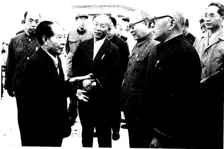
1984年10月27日，胡耀邦(左二)在日照视察。 前右二苏毅然，左一李洪成。