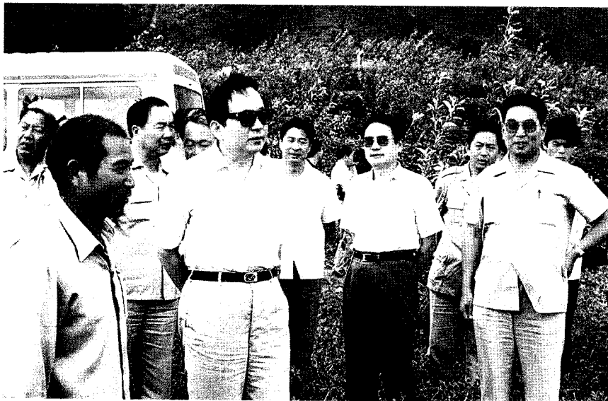
1990年9月6日，田纪云(前左二)在蒙阴县龙虎寨村考察山区扶贫开发情况。后左二王乐泉，前右一王渭田，前右二杨雍哲。