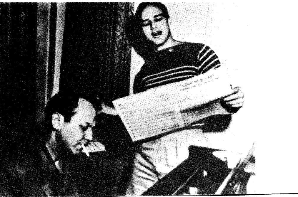
与作曲家弗兰克·罗赛在一起