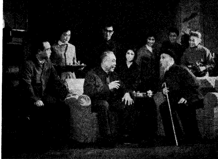
方凌轩（郑榕饰）：“……总理说冠心病是多发病常见病，应该研究研究怎样防治。”（第一幕）