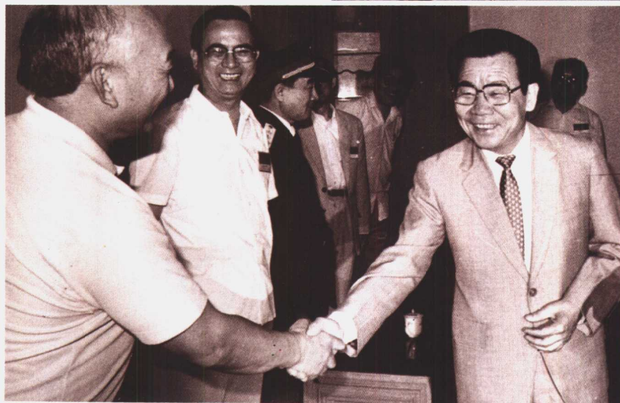
中共中央政治局常委李瑞环，出席在广州召开的中国职工思想政治工作研究会第六次年会，中国医药职工思想政治工作研究会在这次会上获奖，图为李瑞环同志与齐谋甲会长亲切握手。（1990年5月18日）