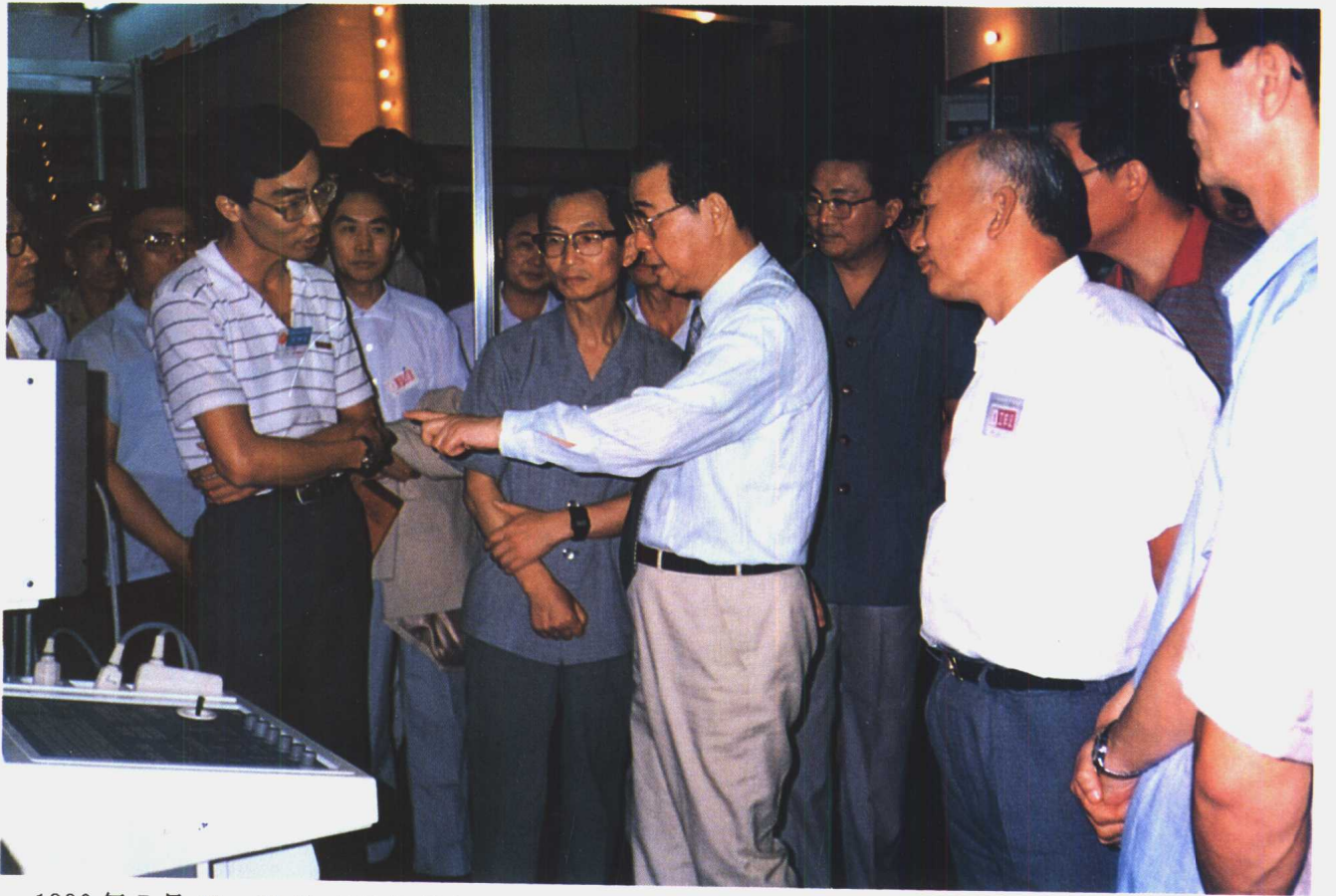
1990年7月16~21日李鹏总理参观全国医药卫生科技成果展览