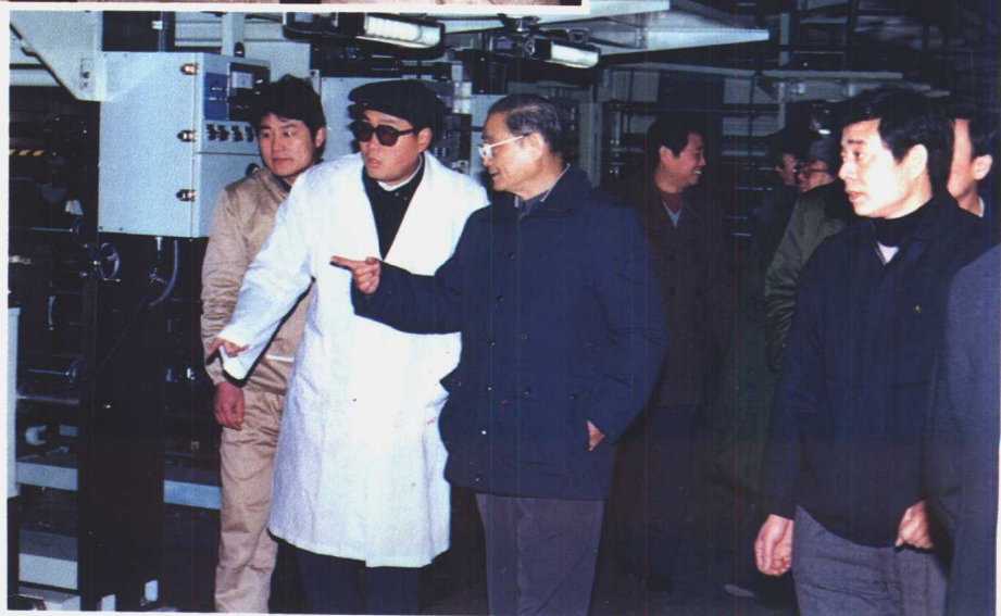
1990年宋平视察连云港 药用包装材料厂