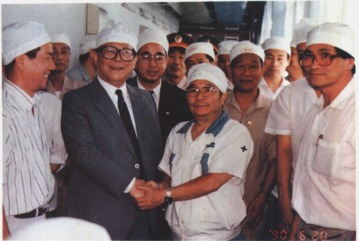
1990年6月20日江泽民总书记视察汕头特区鮑滨制药厂