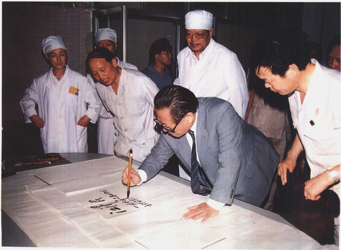
1990年6月24日江泽民总书记视察珠海生化制药厂并签字留念