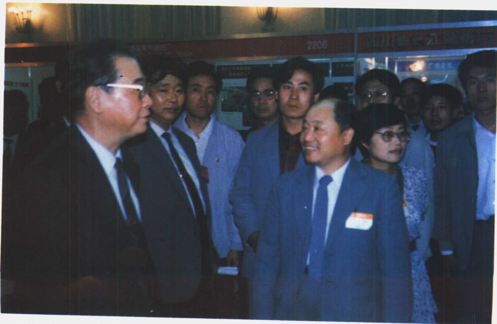
1990年7月在全国医药卫生科技成果展览会上李鹏总理参观上海第三制药厂展台