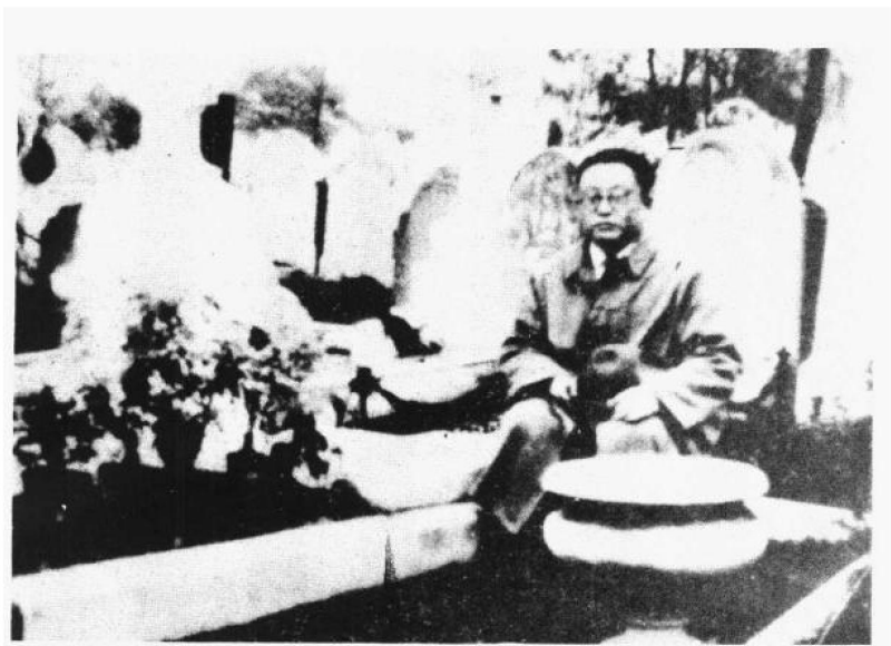
在伦敦瞻仰马克思墓留影并题诗（1936）