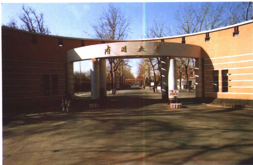
新修的南开大学东校门