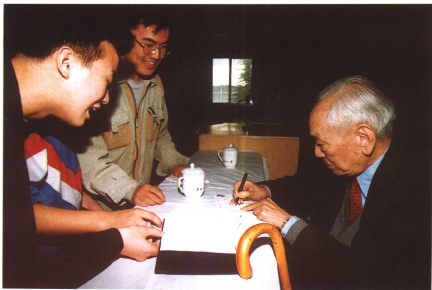
国际著名数学大师陈省身教授为同学们签名