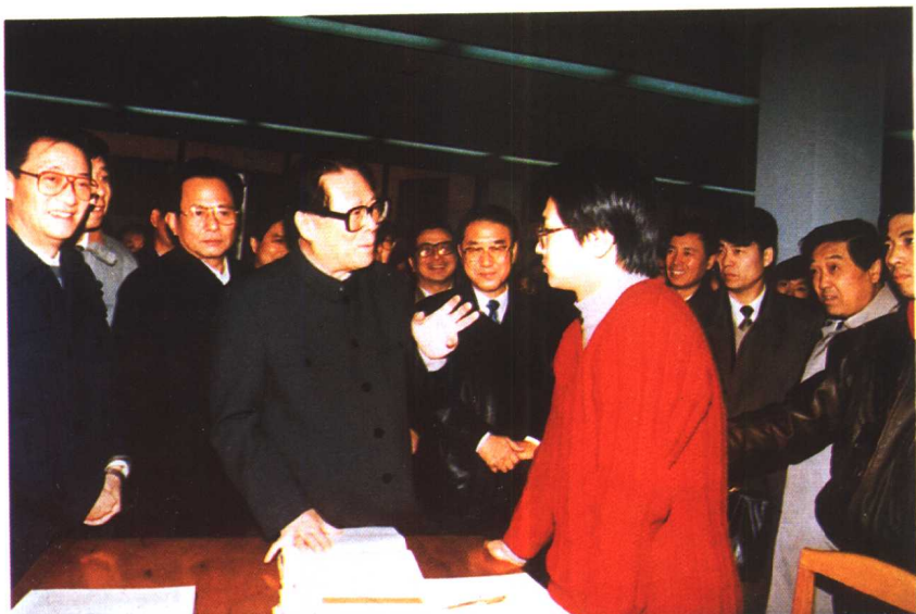
1994年12月，江泽民总书记视察南开大学时与同学畅谈古典诗词