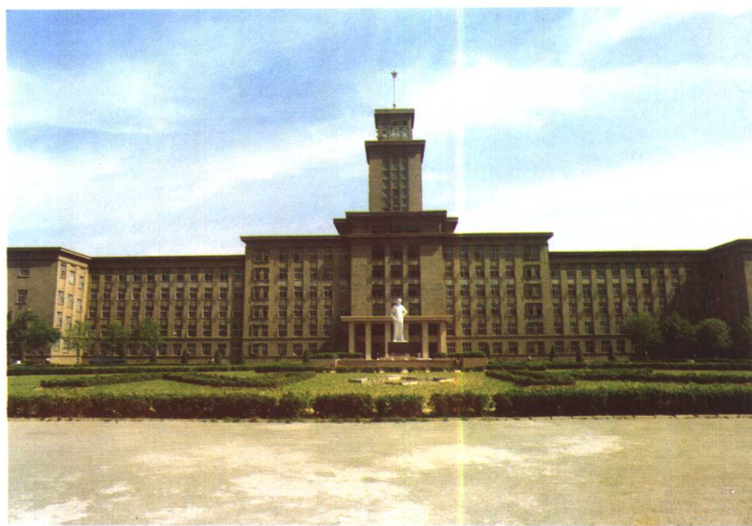
南开大学主教学楼