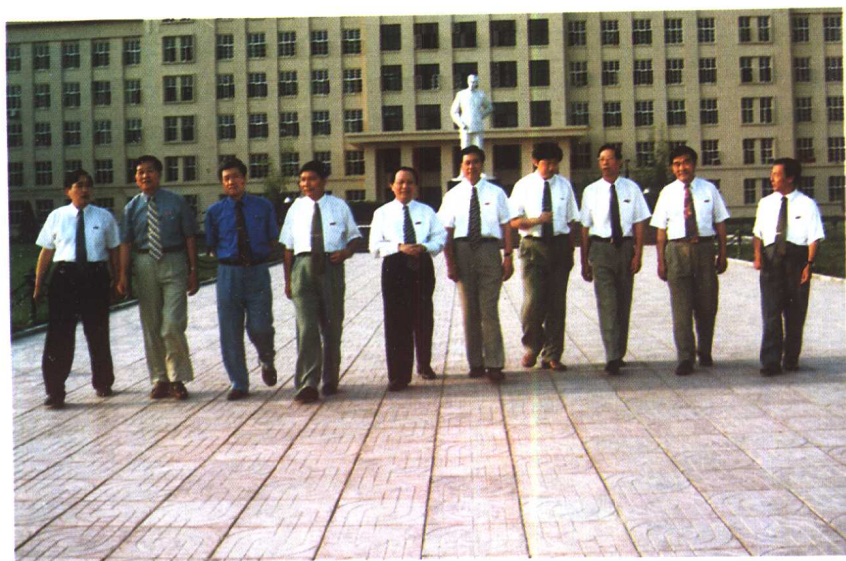
团结奋进的校领导班子