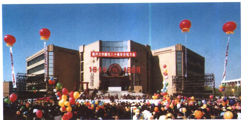
南开大学建校八十周年庆典大会