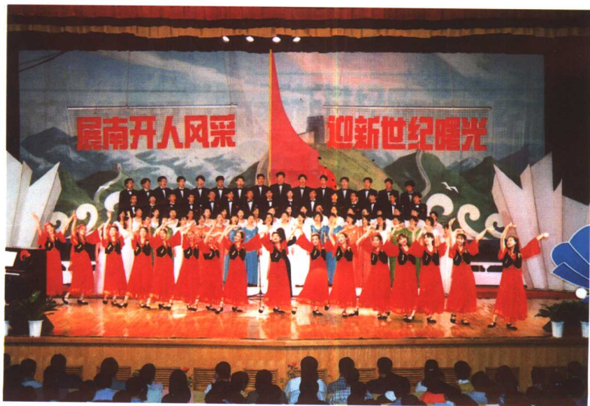
南开大学学生合唱团