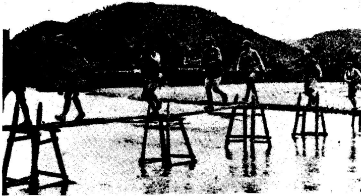
图2 第一次长沙会战,中国军队反攻岳阳。