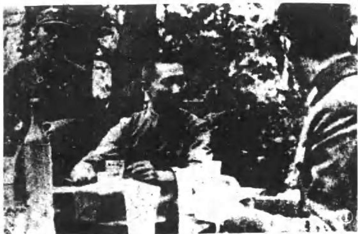
图3 指挥第九战区部队进行三次长沙会战的司令长官薛岳(中)。