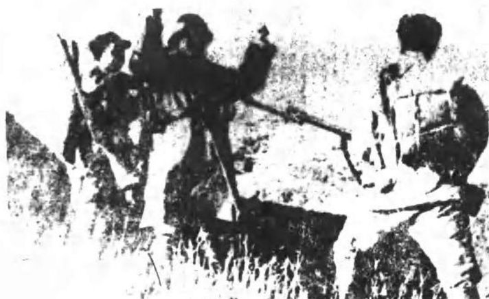
图4 战斗结束时,日军向中国战士投降。