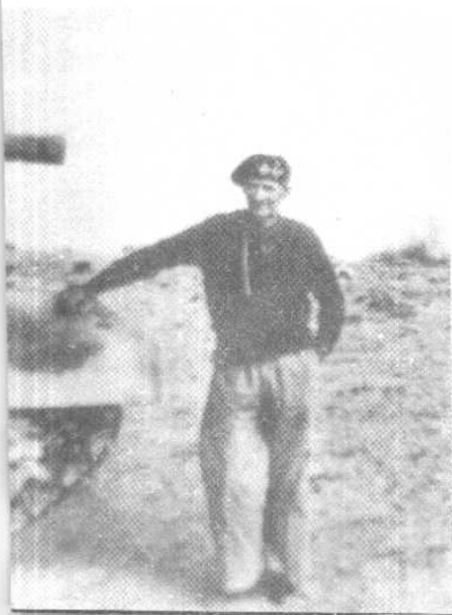
▼ 1942年，蒙哥马利戴着别具一格的黑色贝雷帽，斜撑在美国制造的功勋坦克上。