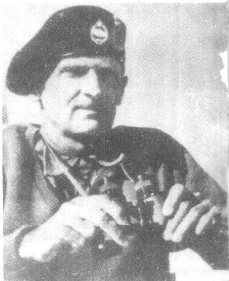
▲ 蒙哥马利在的黎波里郊外。这是北非最后一个未攻克的意大利港口，1943年1月23日落入他的手中。