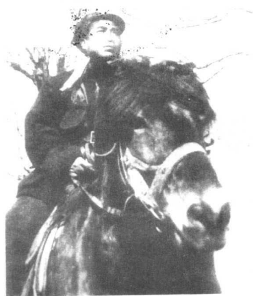
朱德在解放战争时期