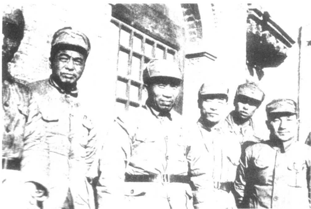
朱德（左三）、彭德怀（左四）、肖克（左二）、彭雪枫（左五）、邓小平（左六）、等在山西省武乡县八路军总部合影