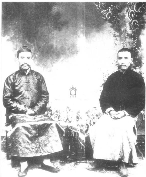
1918年，朱德（左）和孙炳文在四川泸州合影