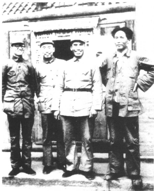
毛泽东、朱德博古在延安