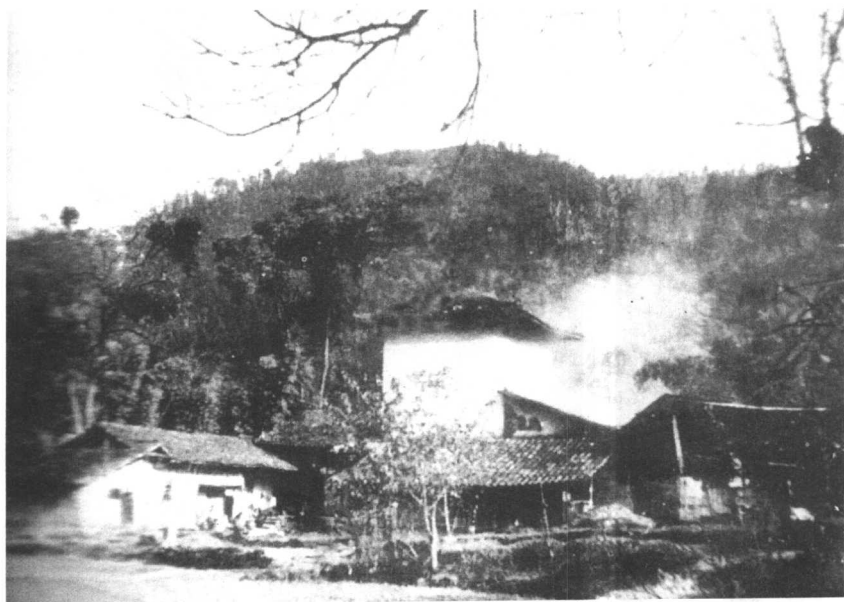
朱德的故乡四川省仪陇县马鞍场琳琅寨李家湾

1909年，朱德为寻求新的生活道路，原离家乡，去云南昆明。同年二月，朱德考入云南陆军讲武堂。毕业后朱德被分配到云南新军蔡锷部下任司务长。1911年在辛亥革命中，参加了云南武装起义，任队官（相当于连长）。图为云南陆军讲武堂校门。