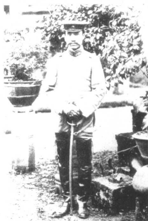
1916年秋，护国军攻克成都，朱德摄影留念