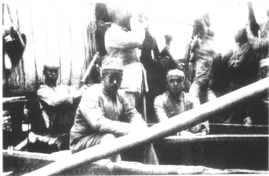
1937年8月至9月，八路军先后深入华北敌后。9月6日，朱德、彭德怀等率领八路军总部从陕西东渡黄河向山西挺进。图为朱德（右一）和八路军政治部主任任弼时（右二）、副参谋长左权（右三）等在渡船上。