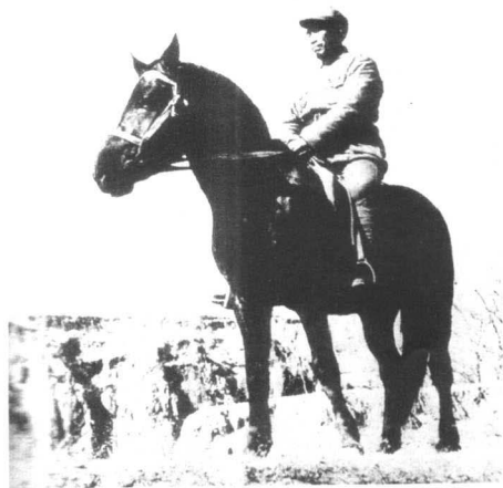
朱德、陈毅、粟裕在濮阳合影