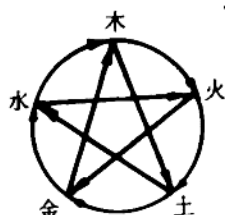
图 1-1 相生、相克