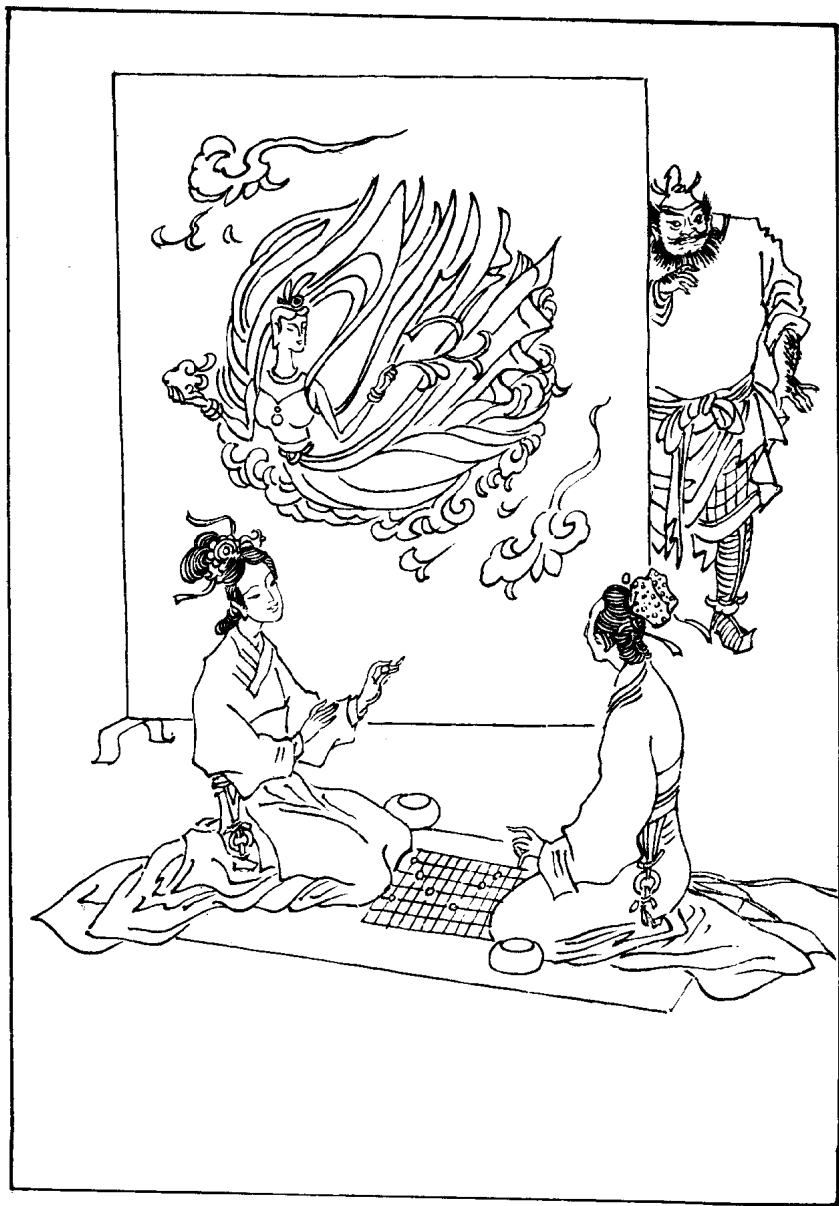
孙尚香与樊氏对弈