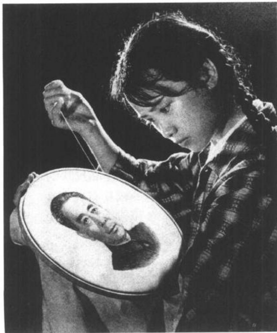
图1 深切的怀念 郭谦摄

20世纪70年代末，北京举行了一次全国摄影展览。影展上有一幅为怀念周恩来总理而创作的摄影作品《深切的怀念》(图1)。当时摄影界内部对这幅作品展开了一场争论。因为照片所摄下的刺绣女青年是一位并不会刺绣的艺术学校女学生，总理像也是另请画家绘制的；照片是拍摄者几经构思，按照自己的意图让女学生像演员