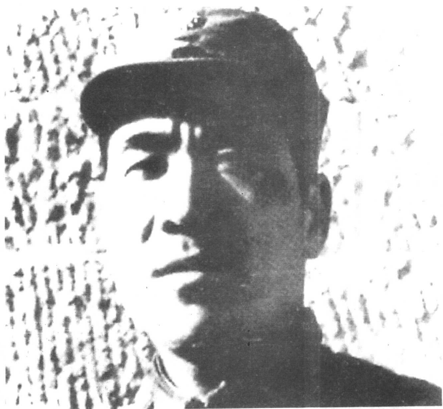
林彪任东北人民自治军总司令