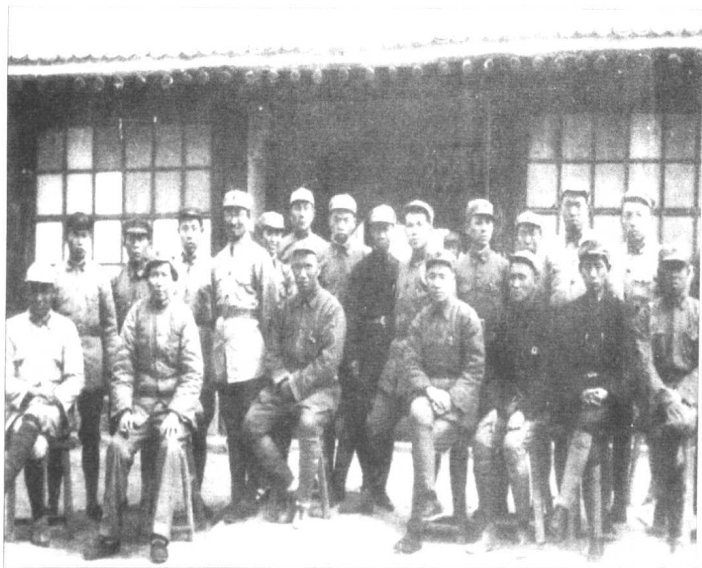
1937年1月，中国抗日军事政治大学 改名为中国人民抗日军事政治大学。 图为1937年春，毛泽东、朱德与该校部分 干部、学员合影。前排左二起：毛泽东、 朱德、林彪、何长工；后排左四陈庚、 左五贺子珍。