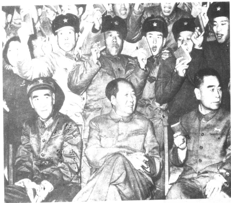
林彪与毛泽东、周恩来同志在一起