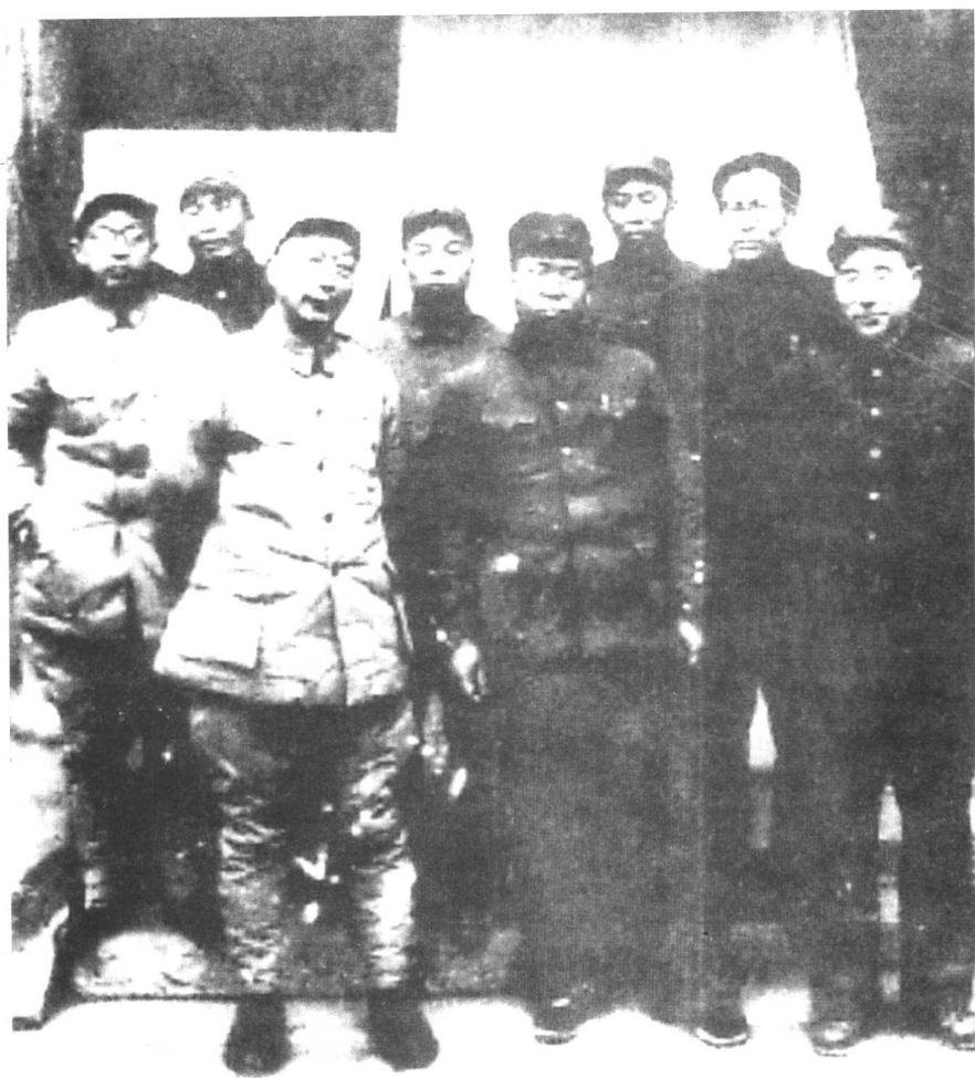
东北野战军和华北野战军负责人