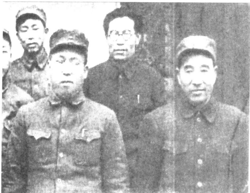
第四野战军司令员林彪第一政委罗荣桓在平津前线合影。