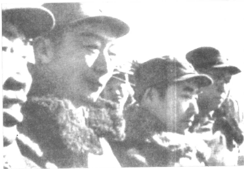
林彪、聂荣臻、罗荣桓在前门箭楼上检阅入城部队。