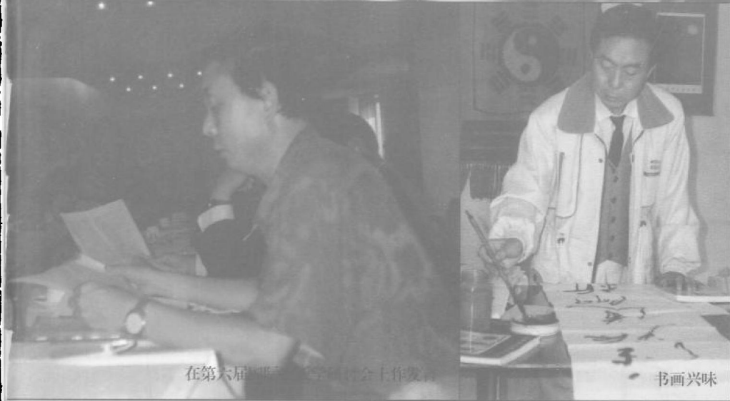
在第六届国际出版学研讨会工作发言